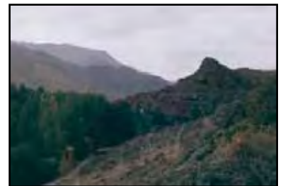
نگاره (۳) معماری خانه‌های روستای ایبانه و گسترش روستای ایبانه بر روی شیب کوه

k۱ آهک، Ec۱ کنگلومرا، مارن و آهک‌های نومولیت‌دار، jsh۱ شیل، ماسه سنگ با آهک حاوی آمونیت، jsh۲ کنگلومرا، شیل و ماسه سنگ Rsh، دولومیت زرد، Qt۲ تراس‌های با ارتفاع متوسط، Qt۳ تراس‌های با ارتفاع متوسط، Qal آلوویوم و رسوبات رودخانه‌ای عهد حاضر. اقلیم دره ایبانه، ترکیبی از آب و هوای مدیترانه‌ای است. طولانی‌ترین فصل آن زمستان است و تابستان‌های معتدل دارد. متوسط دمای سالیانه ۲۲ درجه و متوسط بارندگی ۲۱۴ میلیمتر و متوسط رطوبت سالیانه آن ۴۵ درصد است. پوشش گیاهی مشخص این منطقه گون است، در این منطقه گز، خارشتر، گل گاو زبان، ختمی و در ارتفاعات زرشک وجود دارند. اقتصاد ایبانه عمدتاً مبتنی بر کشاورزی، باغداری و دامداری بوده و گویش محلی ایبانه پهلوی ساسانی و پیرو مذاهب تشیع و زرتشت هستند. در سرشماری سال ۱۳۷۷ ساکنان این روستا ۳۰۸ نفر بوده‌اند که ۲/۳ جمعیت بالای ۶۰ سال سن دارند.