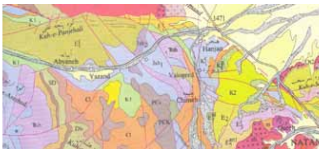
نگاره (۲) نقشه زمین‌شناسی ۱:۱۰۰۰۰۰ از منطقه مورد مطالعه

از نظر ساختمان زمین‌شناسی اشتوکلین عمده‌ترین ساختمان در رشته کوه‌های بین کاشان - اردستان (که دره ایبانه را شامل می‌شود) را طاق‌دیس بزرگ بالا آمده می‌داند که هسته مربوط به پالئوزوئیک - تریاس آن در منطقه ایبانه رخنمون دارد. روند محور این طاق‌دیس شمال غرب - جنوب شرق بوده که بر روند عمومی منطقه منطبق است. جنس سنگ‌های دره ایبانه متفاوت بوده، به طوریکه از قبیل دولومیت‌های سبز رنگ ماسه سنگ‌های قرمز رنگ، آهک‌های تربولیت‌دار بر روی ماسه سنگ‌ها (ماسه سنگ و کنگلومرای ایبانه با ضخامت ۵۰ متر و دانه‌های ریز قرمز رنگ که دارای میان لایه‌های مارن ماسه‌ای و شیل می‌باشد، به طور هم شیب ولی با وقفه‌ای در رسوب‌گذاری و بر روی نهشته‌های پرمین قرار گرفته است) دیده می‌شود. لذا در اثر فعالیت‌های تکنونیک و گسلی، کاملاً خرد شده و ایجاد پرتگاه‌هایی را نموده است. تشکیلات دوران سوم (رسوبات ائوسن) شامل کنگلومرا و آهک‌های نومولیت دار و مارن در انتهای دره یارند و توده‌های عظیم و لکانیک اسیدی و بازی از قبیل آندزیت و توف آندزیت و رسوبات آبرفتی دوران چهارم به خوبی دیده می‌شود (نگاره ۲) لایه‌های رسوبی منطقه را با توجه به درجه پلاستیسیته (از شکنندگی تا شکل‌پذیری) می‌توان به دو بخش سنگ‌های سخت که بیشتر از ماسه سنگ و رسوبات کربناته تشکیل یافته و نهشته‌های نرم که بیشتر شامل شیل، مارن و آهک می‌باشد، قسمت نمود. روشن است که رسوبات نرم بیشتر چین خورده و کمتر شکسته شده‌اند و حال آنکه این مورد در رسوبات سخت به عکس می‌باشد. به طور کلی سن چین‌های رسوبی از کامبرین شروع شده و به زمان حاضر می‌رسد.