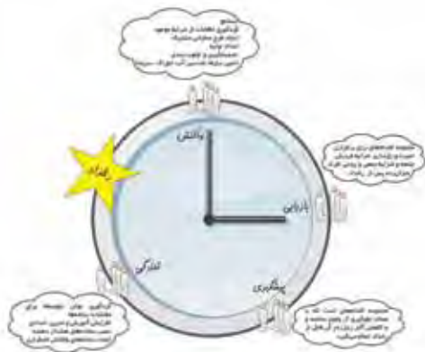
نگاره ۱: فازهای مدیریت سوانح طبیعی