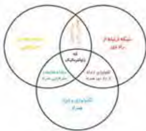
نگاره ۴: علوم و فن آوری های مرتبط با تله ژئواینفورماتیک

به بیان دیگر و با در نظر گرفتن تعریف بالا تله ژئواینفورماتیک در برگیرنده خدمات مکان مبنا LBS ۲۴ در بستر ارتباط از راه دور است. در نگاره ۳ معماری عمومی تله ژئواینفورماتیک نشان داده شده است. این فن آوری که در سال ۲۰۰۴ توسط کریمی ۲۵ از دانشگاه پیتزبورگ ۲۶ پنسیلوانیا ۲۷ در ایالات متحده آمریکا ارائه شد، در نتیجه یکپارچه سازی علوم و فن آوری های محاسبات همراه، ارتباطات (با سیم و بیسیم) و علوم ژئواینفورماتیک (RS, GPS, GIS) مطرح شده است. که در نگاره ۴ نشان داده شده است.