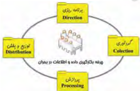
نگاره ۲: چرخه بکارگیری اطلاعات در فاز واکنش مدیریت سوانح طبیعی

همانگونه که در تعریف مدیریت بحران آورده شد، دولتها و سازمان‌های درگیر، با بکارگیری علوم و تکنولوژی‌های نوین در فازهای مختلف مدیریت بحران کوشش می‌نمایند که خسارت‌های ناشی از زلزله را کاهش داده و هرچه سریعتر شرایط جامعه را به حالت عادی بازگردانند. لازمه رسیدن به این هدف، داشتن اطلاعات است. گردآوری اطلاعات در مراحل پیش و پس از وقوع زلزله کار بسیار دشواری نخواهد بود، زیرا جامعه آسیب‌دیده از دست پاچگی در آمده و منابع امکان گردآوری اطلاعات را به سازمانها و نهادهای مسئول خواهد داد. اما ساعتهای نخستین پس از زلزله و مادامی که جامعه در شرایط بحرانی به سر می‌برد، گردآوری اطلاعات از قبیل: حجم خسارت وارده، مناطق آسیب دیده، مناطق مستعد خطر، پراکنش خسارات، پراکنش منابع و امکانات، اولویت‌بندی مناطق از لحاظ خدمت رسانی، حجم خدمات‌های مورد نیاز هر منطقه و .... بسیار سودمند و در این حال دشوار خواهد بود. اقدام‌های ذکر شده همگی در فاز واکنش انجام می‌گیرند. در نگاره ۲ روند بکارگیری اطلاعات در فاز واکنش نشان داده شده است. از این رو با توجه به توانایی‌های بالای علوم ژئوماتیک در فاز واکنش، در این پژوهش بر فاز واکنش در مدیریت بحران تمرکز خواهیم کرد.