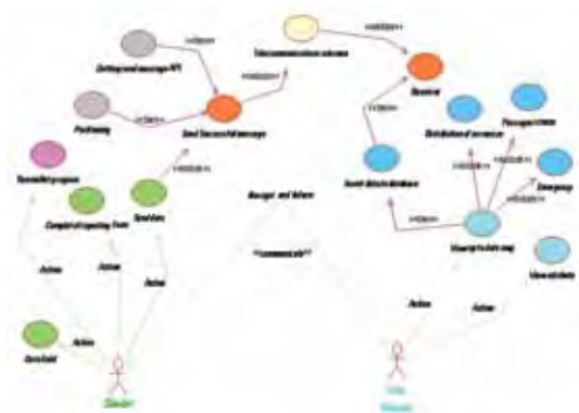
نگاره ۶: مدل سامانه مدیریت بحران زلزله پیشنهادی با UML

همانگونه که بیان شد معماری پیشنهادی براساس زیرساخت‌هایی که در بیشتر کشورها در دسترس است، ارائه شد. پیشنهاد می‌شود که بخش‌هایی از این معماری که در زیر آورده شده‌اند، در صورت در دسترس بودن تکنولوژی مربوط به صورت پیشرفته‌تر پیاده سازی شوند.