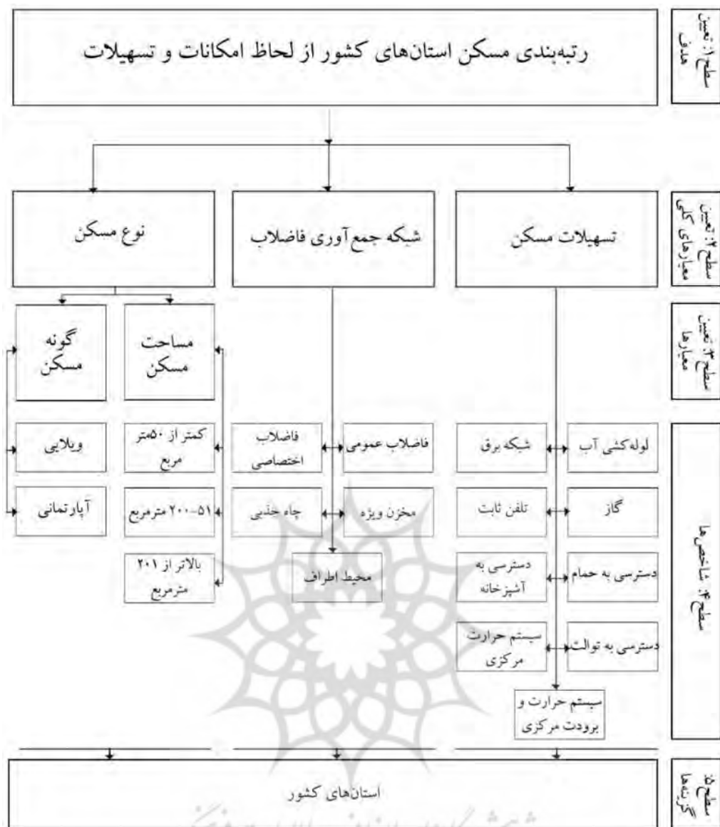
شکل ۱- ساختار سلسله مراتبی تعریف شده برای نرم‌افزار EC

معیارهای کلی در واقع ملاک‌های متضمن هدف و سازنده آن می‌باشند و به گونه‌ای وسیله‌ای برای اندازه‌گیری اهداف محسوب می‌شوند. جدول ۱، نشان‌دهنده اهمیت نسبی معیارهای کلی از دیدگاه کارشناسان می‌باشد. بر این اساس تسهیلات مسکن (که شامل ۸ شاخص قابل اندازه‌گیری بوده) هشت برابر سیستم دفع فاضلاب دارای اهمیت بوده، نوع تسهیلات دو برابر گونه مسکن (مساحت، ویلایی و آپارتمانی بودن) ارزش و اهمیت داشته است همچنین نوع مسکن چهار برابر سیستم فاضلاب دارای اهمیت بوده است. نرخ ناسازگاری مقایسه زوجی این معیارهای کلی ۰/۰۲ می‌باشد که نشان‌دهنده دقت قابل قبول این مقایسه است.