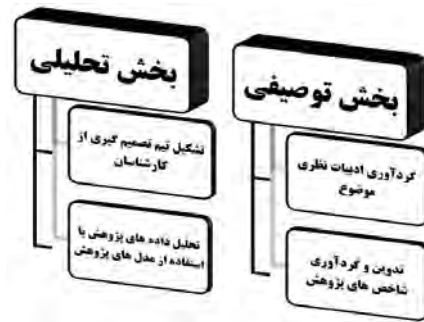
شکل ۱: مدل مفهومی فرایند اجرای تحقیق