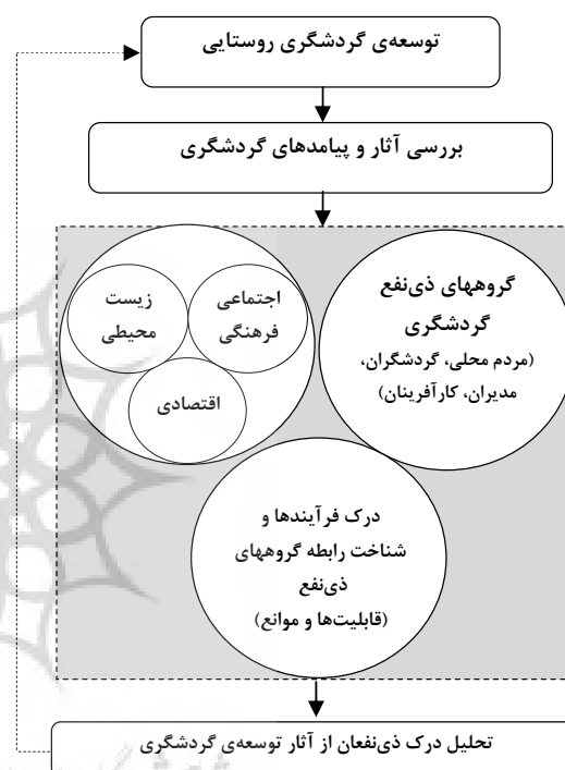
شکل ۲: مدل مفهومی تحقیق

کارآفرینان و نیز مدیران منابع (مدیران و مقامات محلی) دسته‌بندی نمود که با روابط متقابلی که دارند در شکل‌گیری فعالیت‌های گردشگری نقش ایفا می‌کنند. بنابراین می‌باید در بررسی آثار گردشگری در نواحی روستایی هر چهار ذی‌نفع دخالت داده شوند (شکل ۲).