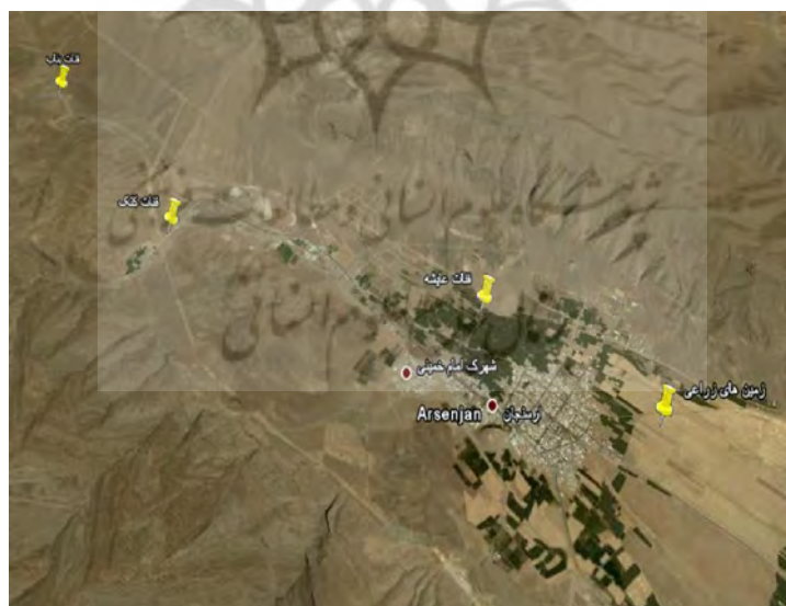
شکل ۲) تصویر ماهواره‌ای کاریزهای آرسنجان و زمین‌های زراعی تحت پوشش، (منبع: شرکت دیجیتال گلوب، سازمان زمین-شناسی ایالات متحده آمریکا، ۲۰۱۳)

نگاهی به ویژگی‌های فیزیکی و آبدهی کاریزهای آرسنجان نشان می‌دهد کاریزهای آرسنجان که گردانندگی، بهره‌برداری و پخش آب آن به شیوه تعاونی و همیاری همگانی است، دارای سه رشته کاریز به نام‌های عایشه، بناب و کتک