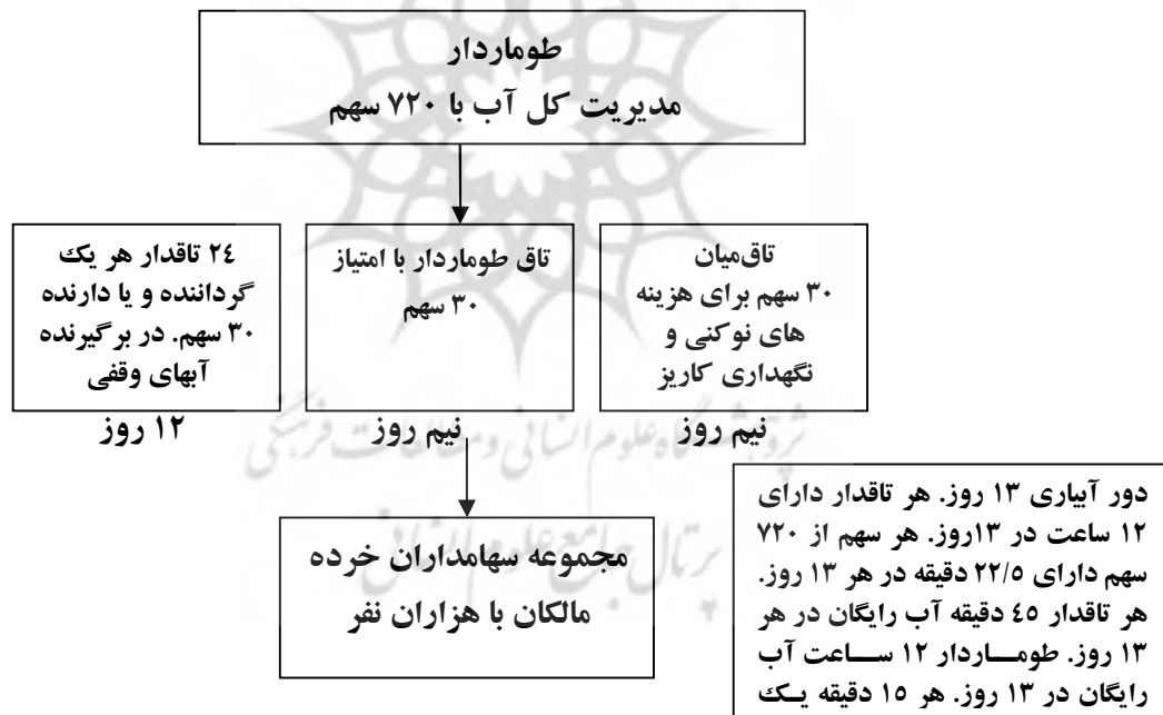
شکل ۳) سامانه مدیریتی مجموعه کاریزهای عایشه، کتک و بناب

روان بودن آب کاریز افزون بر دارندگان آب، بر چگونگی زندگی تأقدار، میراب و طوماردار سایه می‌افکند و همگی کوشش می‌کنند تا آب کاریز هر چه بیشتر در جویبارها روان باشد. گرچه در این سال‌ها با ندانم کاری‌های دست‌اندرکاران حفر چاه‌های عمیق در نزدیکی کاریزهای ارسنجان بسیاری از آنها را خشکانده است، سامانه گرداندگی کاریزهای ارسنجان توانسته است تا اندازه‌ای پذیرفتنی از تجاوز به حریم کاریزهای وابسته به خود جلوگیری کند. نگهداری کاریزها در برابر یورش موتور پمپ، از سازوکارهای ریشه‌ای روان بودن آب کاریزهای ارسنجان است. در شکل (۲) برخی از ویژگی‌های گرداندگی سامانه کاریزهای ارسنجان نشان داده شده است.