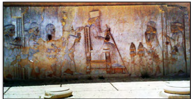
تصویر ۱. نقش برجسته هخامنشی، موزه ایران باستان، مأخذ: Godrej, 2002: 59.

Fig. 2. The linear view of Hong Arjang relief, belonging to the Parthian era. Source: Mohammadifar, 2007.