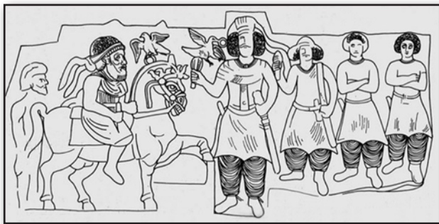
تصویر ۲. نمای خطی از نقش برجسته هونگ ارژنگ، متعلق به دوره اشکانی، مأخذ: محمدی‌فر، ۱۳۸۶.

Fig. 2. The linear view of Hong Arjang relief, belonging to the Parthian era. Source: Mohammadifar, 2007.