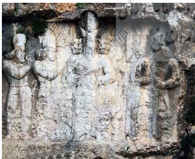
تصویر ۳. نقش برجسته سرآب بهرام متعلق به دوره ساسانی، واقع در نزدیکی نور آباد پائین شاپورفهلپان، مأخذ: جوادی، ۱۳۸۸: ۹۵.

Fig. 3. Sarab-e Bahram reliefs belonging to the Sassanid era, located near Noor Abad. Source: Javadi, 2010: 95.