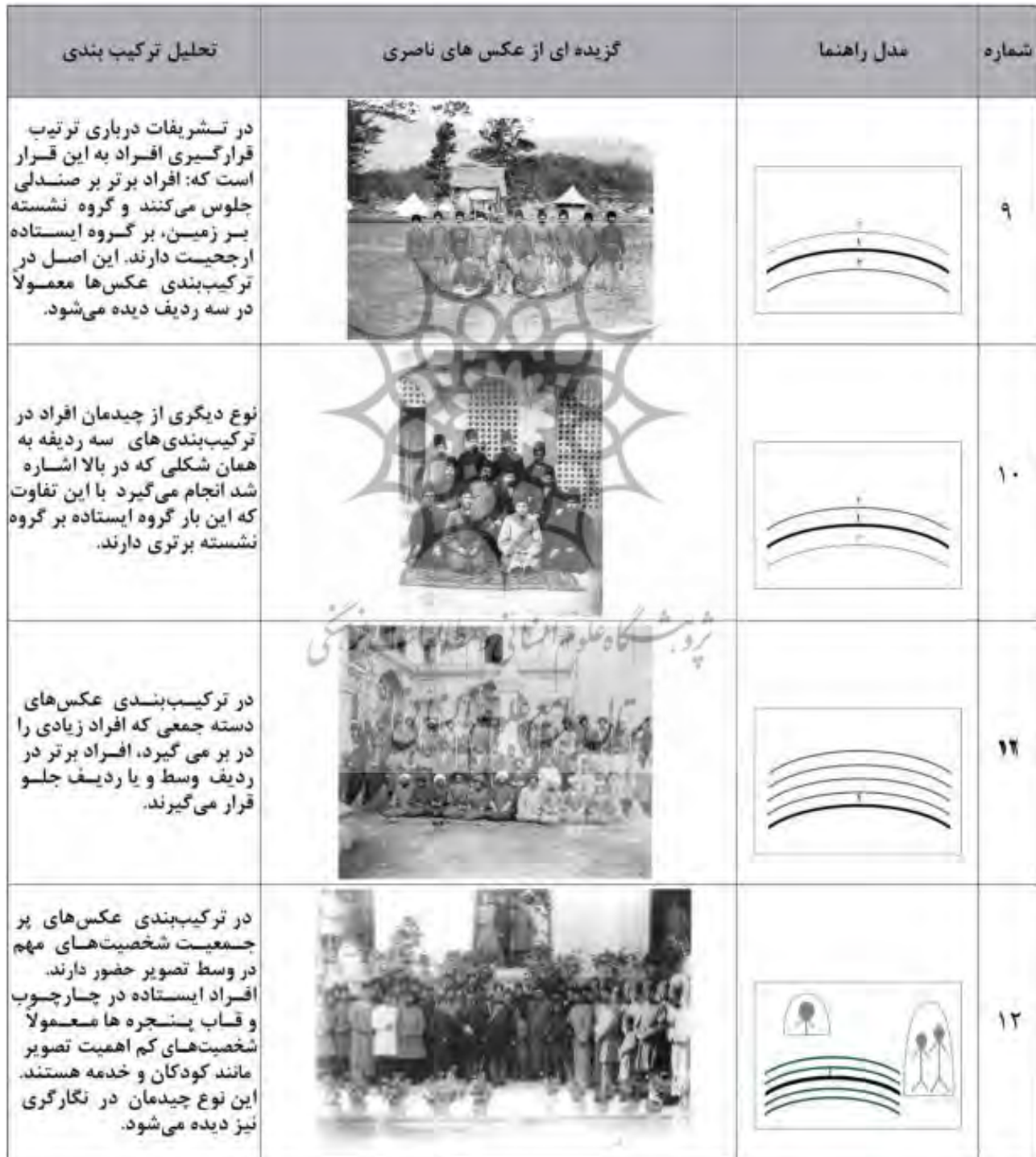
Table 1. analyzing the composition of people in family photos of Naseri Era (during the rule of Naser al-Din Shah. Source: author. Fig 9, 10, 11, 12: Fig 5, 6, 8: Semsar & Soraiyan, 2003.

مأخذ تصاویر ۹، ۱۰، ۱۱ و ۱۲: سمسار، محمدحسن و سراییان، فرهاد، ۱۳۸۲.