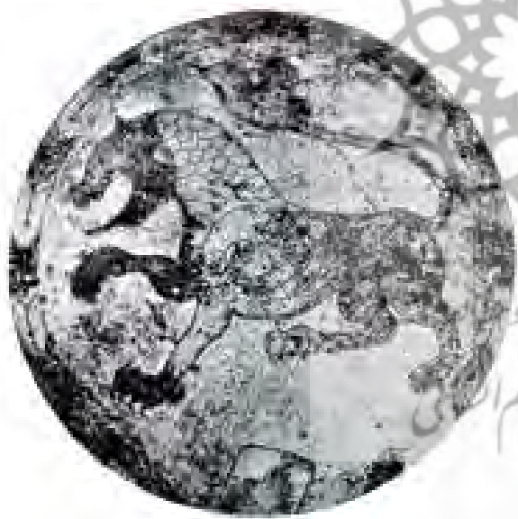
تصویر ۴. سینی نقره‌ای قرن دهم میلادی، اروپای مرکزی، مجارستان.

«علیرضا طاهری» در مقاله «نقوش "حیوان-گیاه" در هنر ساسانی و تأثیر آن بر هنر اسلامی و هنر رومی وار فرانسه» اشاره به ظرف نقره‌ای مربوط به قرن دهم در اروپای مرکزی می‌کند. نگارنده مقاله در خصوص منشأ تولید این ظرف دو احتمال را مطرح می‌کند: