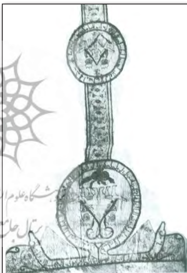
تصویر ۳. پوشش سنت آن. دوره فاطمی. ۹۰۶-۹۰۷ م.