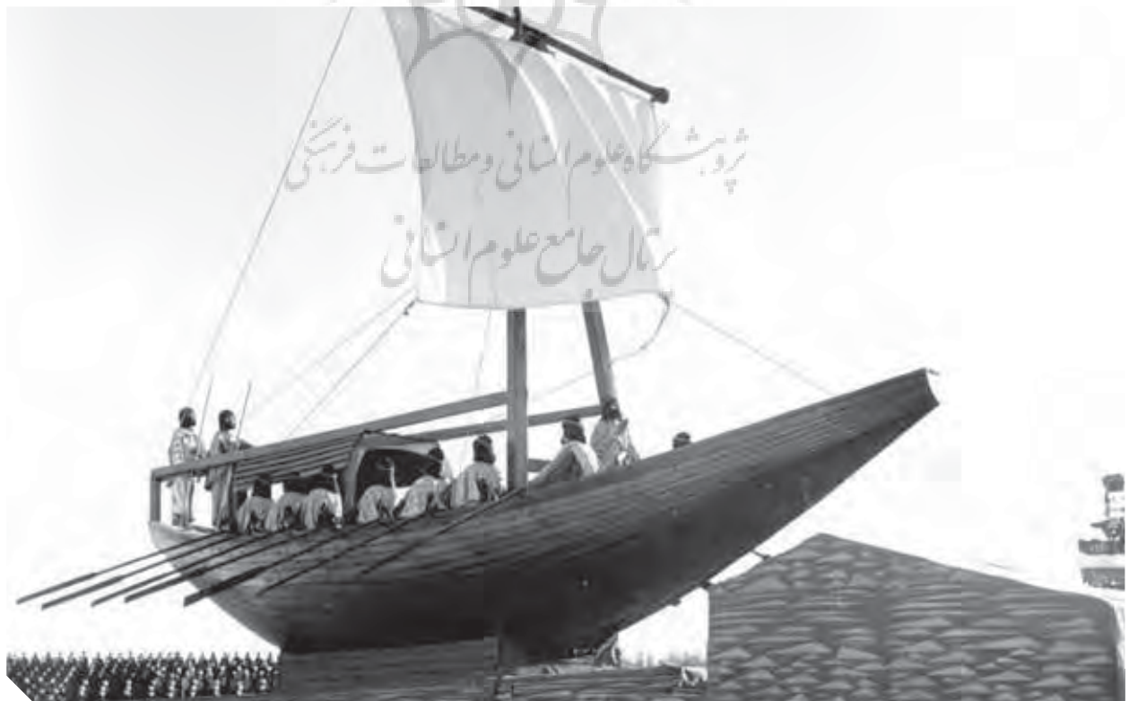
کشتی بادبانی با پوشاک سربازان دوره هخامنشی در مراسم جشن‌های دو هزار و پانصد ساله در تخت جمشید

ایران در ذهن شاه بخشی از تمدن غرب به شمار می‌رفت که در نتیجه یک پدیده جغرافیایی از هم‌تایان خود جدا شده است. به نظر وی ایرانی‌ها نه از نژاد