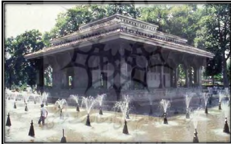
تصویر شماره ۲: معماری کوشک هندی بر اساس چادر