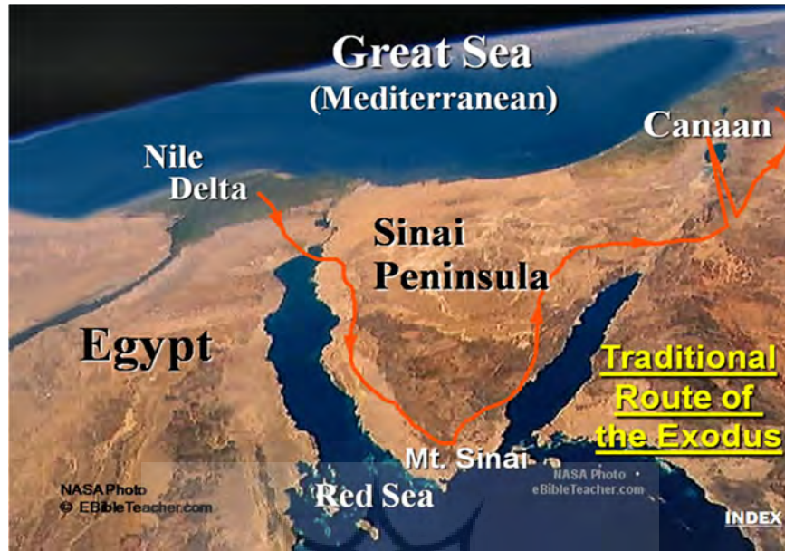
پیوست ۳: مسیر خروج از مصر به فلسطین و عبور از خلیج سوئز (Biblical Atlas)