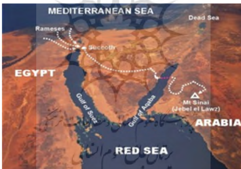
پیوست ۶: مسیر خروج از مصر به فلسطین از منظر "ران وایت" و "جانانان گری" و ترسیم نظریه غرق فرعون در خلیج عقبه