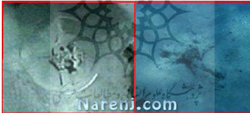
پیوست ۴: تصویر چرخ طلایی ازابه فرعون در اعماق خلیج عقبه