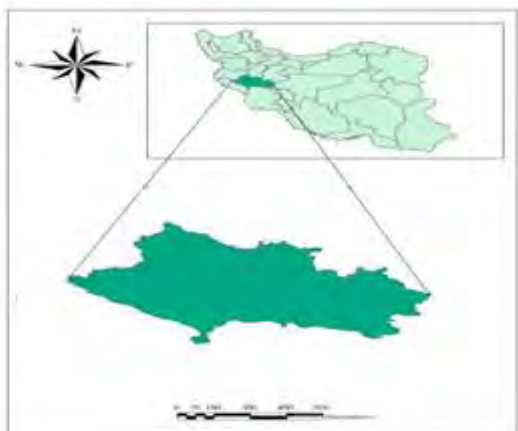
شکل ۱. موقعیت جغرافیایی منطقه مورد مطالعه

اشاره کرد که دارای پتانسیل‌های زیادی در جهت جذب گردشگران می‌باشند. (شکل ۱) موقعیت استان لرستان را در ایران نشان می‌دهد.