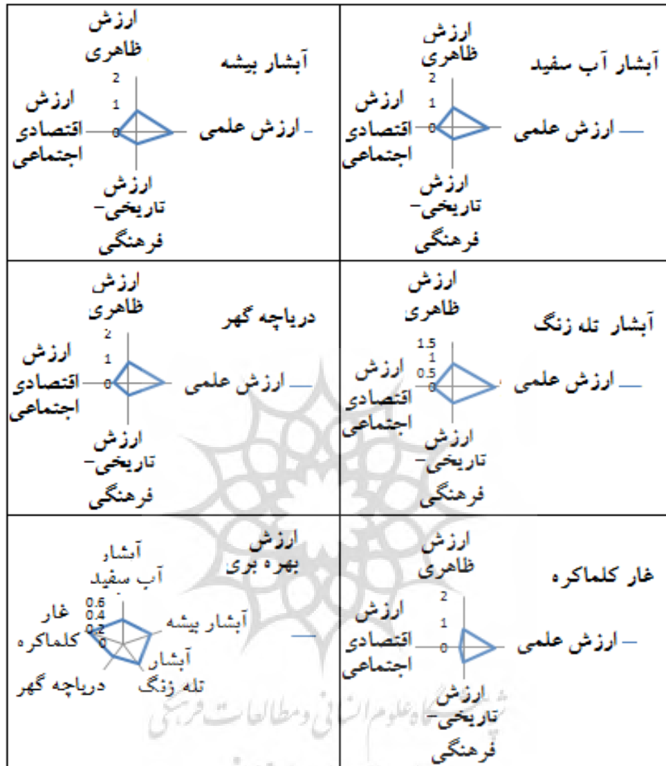
شکل ۴. مقایسه ارزش‌های گردشگری لندفرم‌های ژئومورفولوژیکی منطقه مورد مطالعه

دارای پایین‌ترین ارزش اقتصادی می‌باشد که می‌توان به صعب‌العبور بودن مسیر برای دسترسی به این مکان و همچنین به سطح پایین تسهیلات خدماتی و رفاهی در سطح منطقه اشاره کرد. آبشار آب سفید و آبشار بیشه از لحاظ ارزش تاریخی ° فرهنگی دارای کمترین و غار کلماکره