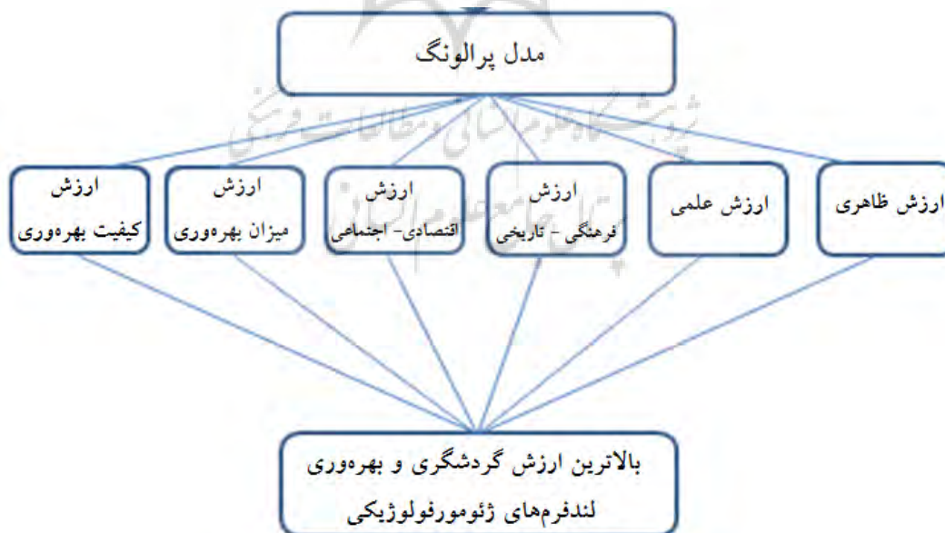
شکل ۲. شاخص‌های ارزیابی جاذبه‌های ژئومورفولوژیک در پژوهش

پس از تکمیل برگه‌های مربوط به هر لندفرم برای تعیین میزان توانمندی و قابلیت زمین گردشگری لندفرم‌ها از مدل پرالونگ (۲۰۰۵) استفاده شده است. بر اساس این مدل