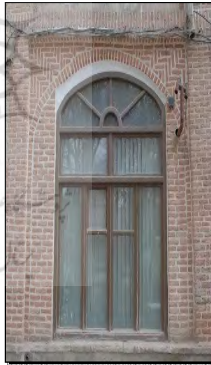
تصویر ۳. اجرای غلط چفد کلیل، سرای حاج حسین میانه