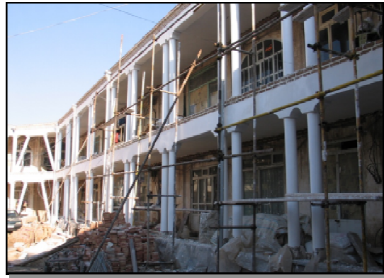
تصاویر ۴ و ۵: احیاء سرای کشک شچیلر

استراتژی جذب سرمایه از مردم به منظور مشارکت در مرمت و احیاء بازار: اقدامات تشویقی پایگاه به منظور اعتمادسازی بین دولت و کسبه بازار و در نتیجه آن جذب مشارکت‌های مردمی در مرمت بازار به شرح زیر است: