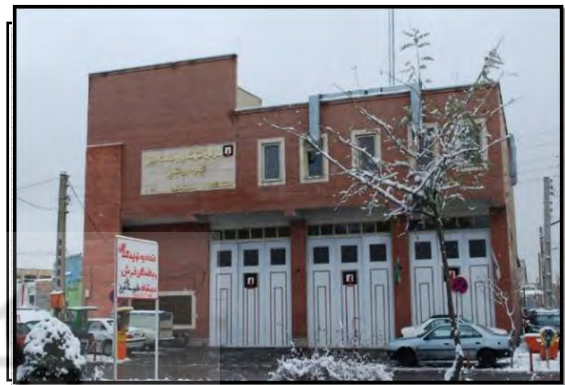
تصویر ۸. راه‌اندازی ایستگاه آتش‌نشانی در بازار تبریز