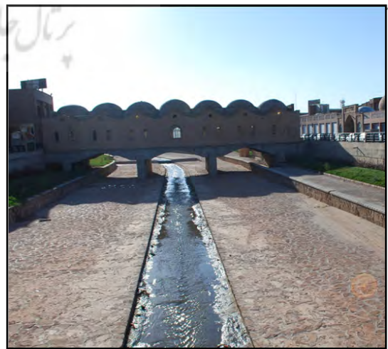
تصاویر ۶ و ۷. ساماندهی مهران رود، پل بازار صادقیه