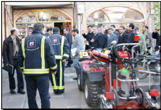
تصویر ۹. طراحی و ساخت ماشین‌های آتش‌نشانی کوچک

- ثبت کلیه اموال و اجناس حجره‌ها با همکاری اداره دارائی به‌واسطه نرم‌افزارها.