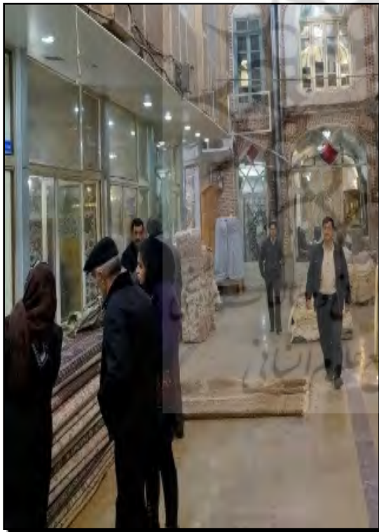
تصویر ۲. احداث پاساژ در حیات سرا، سرای میراسماعیل

- عدم امکان بهره‌مندی از استادکاران و بناهای ماهر و همچنین مصالح مناسب (تصویر ۳). اجرای غلط چفد کلیل آذری در مرمت و تعمیرات مغازه‌ها، بد سلیقه‌گی و عدم دقت در اجرای قوس‌ها و چفدها. - عدم اطلاع از شیوه‌های نوین مرمتی در مواجهه با اثر(مثلاً: در عایق‌کاری بام، بدون توجه به وزن از مصالحی همچون قیروگونی و آسفالت استفاده می‌شد که این وزن موجب آسیب به بدنه‌ها و پایه‌ها می‌گردید). - ارتباط نامناسب با نهادها و دستگاه‌های دولتی.