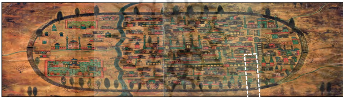
تصویر ۱. نقشه مطراچی، تهیه شده توسط نصح مطراق چی از همراهان سلطان سلیمان عثمانی در لشکرکشی

مجموعه بازار تاریخی تبریز از بناهایی است که از بدو شکل‌گیری خود دارای چالش‌هایی فراوان و اقداماتی در پی آن چالش‌ها بوده است. بنیان اولیه بازار تاریخی تبریز به صدر اسلام برمی‌گردد که گواه این مطلب واقع‌شدن مسجد جامع کبیر شهر در هم‌جواری بازار است. در این میان، گذر جاده ابریشم از شهر و بازار تبریز، اهمیت موضوع را به اثبات می‌رساند. اهمیت این مسیر و گذر آن از داخل شهر تبریز و بازار باعث شده این بازار به قلب تپنده تجاری، اقامتی، مذهبی، فرهنگی، بهداشتی و غیره منطقه بدل شود. در چنین مجموعه‌ای چگونگی ارتباط عناصر مجموعه با یکدیگر و ارتباط آن با دروازه‌های شهر، تقابل فرهنگ‌های مختلف در بازار و شهر، امنیت بازار و تاجران و حوادثی همچون سیل و زلزله چالش‌هایی بوده که مجموعه بازار از ابتدا با آن دست‌وپنجه نرم می‌کند. اغلب مورخین و جهانگردان که از قرن چهارم هجری تا عهد قاجار از تبریز دیدن کرده‌اند اسناد و مدارک مهم و باارزشی را درباره بازار و وضعیت اقتصادی تبریز از خود بجا گذاشته‌اند. از شخصیت‌های فوق می‌توان به مقدسی، مطراچی (تصویر ۱)، یاقوت، مارکوپولو، ابن‌بطوطه، حمدا... مستوفی، کلاویخو، جان‌کارت‌رایت انگلیسی، شاردن و جملی‌کارری و... اشاره کرد.