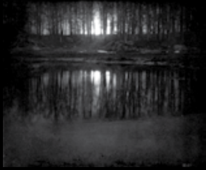
تصویر شماره ۵: طلوع ماه، ۱۹۰۴