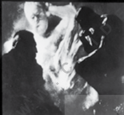
تصویر شماره ۶: رودن و پیکره متفکر، ۱۹۰۴