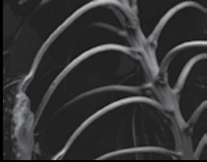
تصویر شماره ۳: ستون فقرات گل آفتابگردان، ۱۹۲۰

یک هنر مستقل در کنار آثار دیگر هنرهای تجسمی مانند نقاشی‌های پیکاسو و ماتیز نمایش داده می‌شد. در سال ۱۹۰۴ استایکن به تجربیاتی در مورد رنگی کردن عکس‌ها پرداخت. نخست رنگ کردن عکس‌های چاپ شده را آژمود سپس به روش اتوکروم این مسیر را پیمود. در سال ۱۹۰۵ برای راه‌اندازی گالری ۲۹۱ [۷] با استیگلیتز همکاری کرد.