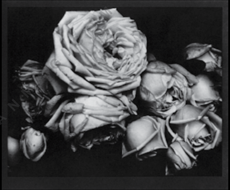
تصویر شماره ۲: رزهای شکفته، ۱۹۱۴

باقی ماند. ادوارد استایکن جوان در سال ۱۹۰۰ آلفرد استیگلیتز [۵] عکاس نوگرا، که در آن زمان سردبیر مجله کمرانوتز بود را ملاقات می‌کند مجله کمرانوتز در جهت اعتلای عکاسی و اشاعه نظریات جدید عکاسی با رویکرد پیکتوریالیستی و تحت پشتیبانی گروه کمراکلاب لندن منتشر می‌شد. این ملاقات باعث شد تا استیگلیتز از توانایی‌های هنری و همچنین علائق استایکن مطلع گردد و ضمن دیدن عکس‌های او سه قطعه از آن‌ها را به بهای هر عکس پنج دلار بخرد. این آشنایی به ظاهر ساده، موجب پایه‌گذاری دوستی و همکاری عمیق بین آن‌ها و همچنین باعث تحولات چشم‌گیر در روند روبه رشد عکاسی از سنت تصویرگرا به مدرن و تعامل عکاسی با دیگر هنرهای تجسمی در سال‌های بعد گردید.