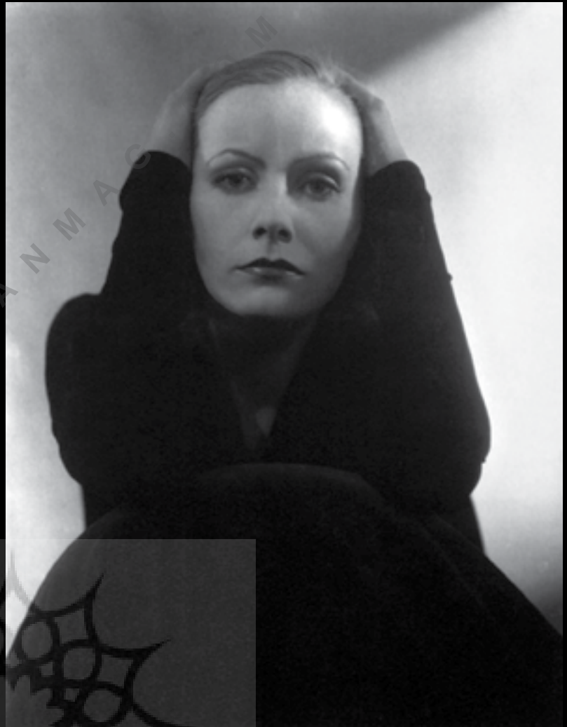
تصویر شماره ۷: گرتا کاربو، ۱۹۲۸