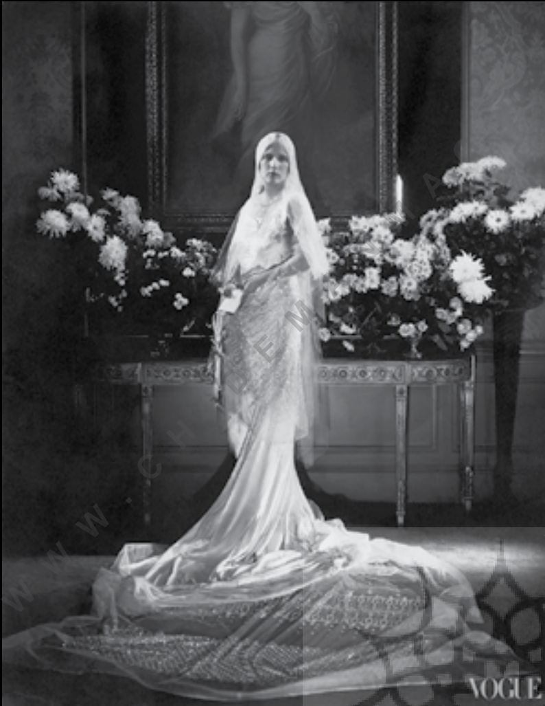
تصویر شماره ۴: Vogue

عکاسی است را مدیریت و برگزار کرد. از کتاب چاپ شده مربوط به نمایشگاه ۲/۵ میلیون نسخه فروش رفت و با گرداندن نمایشگاه در ۶۰ کشور جهان چیزی قریب به ۹ میلیون نفر از آن بازدید کردند.