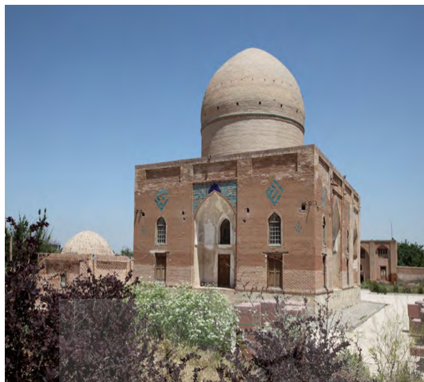
تصویر شماره ۲: کتیبه‌های اسماء مقدس در سطوح بیرونی