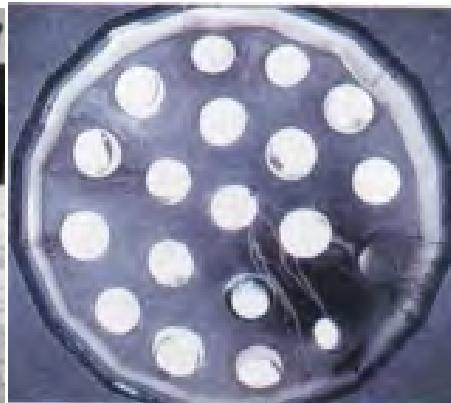
(تصویر ۵) گلجام‌ها در جامه‌خانه حمام گنجعلی خان (Anonymous 2002: 64)

گرمابه‌های مسلمانان و پیروان سایر مذاهب تا قبل از عهد قاجار یکی بوده است؛ چنان‌که قدسی ضمن وصف گرمابه پادشاه، به یکسان بودن آن اشاره کرده است: