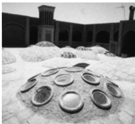
(تصویر ۴) گلجام حمام خان یزد (قبادیان ۱۳۸۲: ۲۹۰)