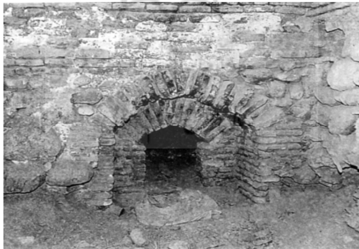
(تصویر ۳) آتشدان (تون) در زیر خزینه حمام فین کاشان (همان: ۲۸۵)

به فضای پردود و خاکستر متصل به گرمابه که کوره در آن بود، پاتون، تون و یا «گلخن» می‌گفتند. (تصویر ۳) راه ورود به گلخن در پشت ساختمان گرمابه بود و در داخل و خارج این فضا خس و خاشاک و تپاله و پهن برای سوخت گلخن انبار می‌شد. آتش تون دیگ خزینه را گرم می‌کرد که در نتیجه آن، آب خزینه داغ می‌شد. دود گرم حاصل از آتش تون نیز با وارد شدن به داخل کانال‌هایی (گربرو) که در سطح زیرین فضاها گرمابه وجود داشت، به صورت تبادل حرارت با کف حمام، موجب گرم شدن فضاها گرمابه می‌شد. کف حمام‌های سلطنتیاز سنگ مرمر بود.