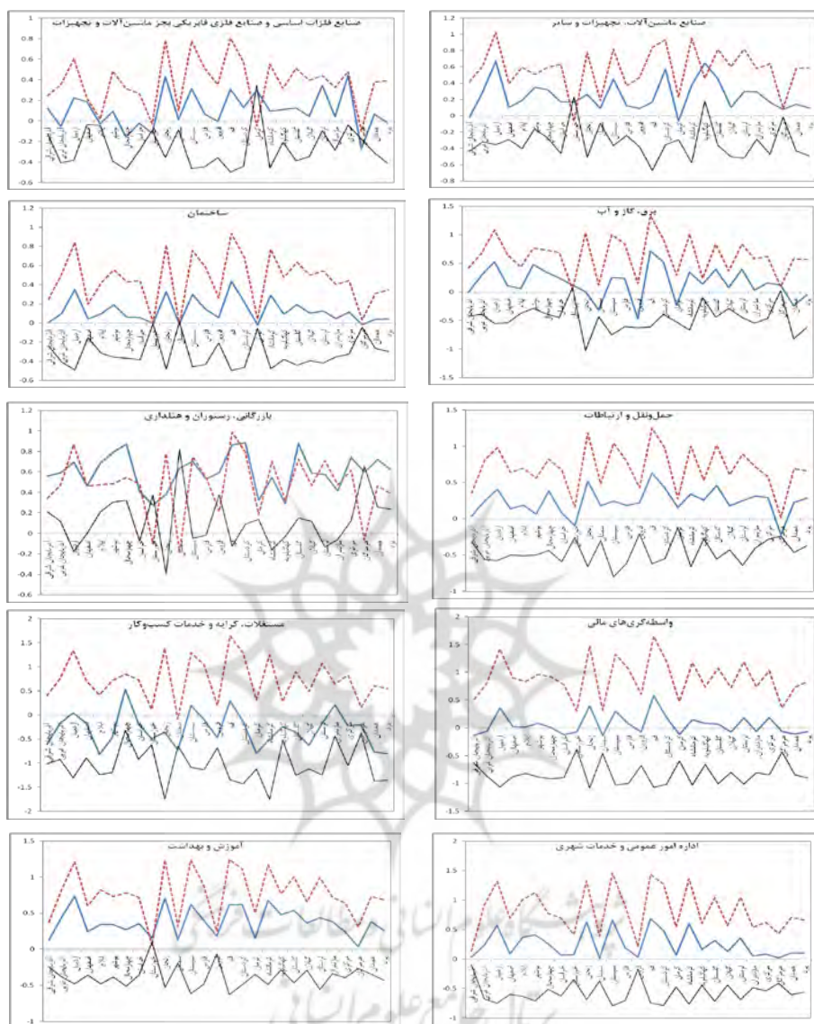
ادامه نمودار ۱. مقایسه اختلاف منطقه‌ای بهره‌وری عوامل واسطه به تفکیک بخش‌های اقتصادی