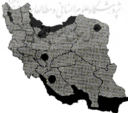
شکل ۳: انتشار جغرافیایی چونندگان مخزن طاعون در ایران، مقیاس ۱: ۲۰۰۰۰۰۰۰ (موبدی، ۱۳۶۴: ۱۱۵)

این بیماری به صورت همیشگی در برخی از کشورها، مانند هندوستان، حضور دارد. در کشور ما هم این بیماری در کردستان به صورت خاموش وجود دارد؛ ولی معمولاً اولین بار توسط کشتی‌ها و در بنادر وارد می‌شود (شکل ۳).