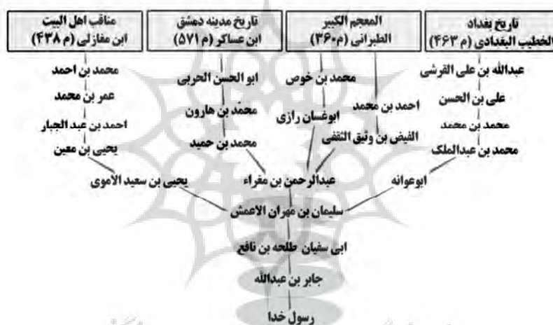
نمودار (۳): شبکه اسناد منتهی به اعمش

نقل دوم روایت صلح امام حسن، از طریق جابر بن عبدالله انصاری (م. ۷۸) از پیامبر است. روایت به این طریق در منابع چهار قرن اول هجری بازتاب اندکی داشته است. طبرانی (م. ۳۶۰) در المعجم الکبیر به دو طریق فرعی روایت را آورده است.