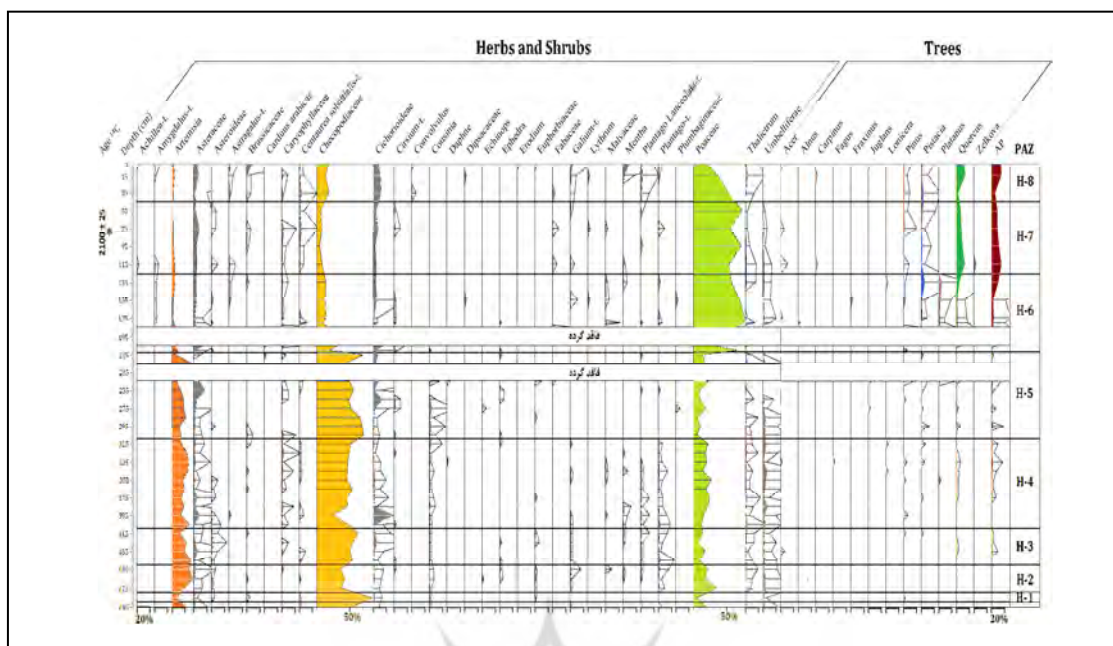
شکل ۲ نمودار گرده درصدی گیاهان علفی، درختچه‌ای و درختی مغزه رسوبی تالاب هشیلان (ترسیم شده بر اساس گرده‌های گیاهی شمارش شده از مغزه تالاب هشیلان)، (خطوط افقی نازک مقطعی از مغزه رسوبی که عملیات آماده‌سازی نمونه و شمارش گرده در آن‌ها انجام شده است را نشان می‌دهد).