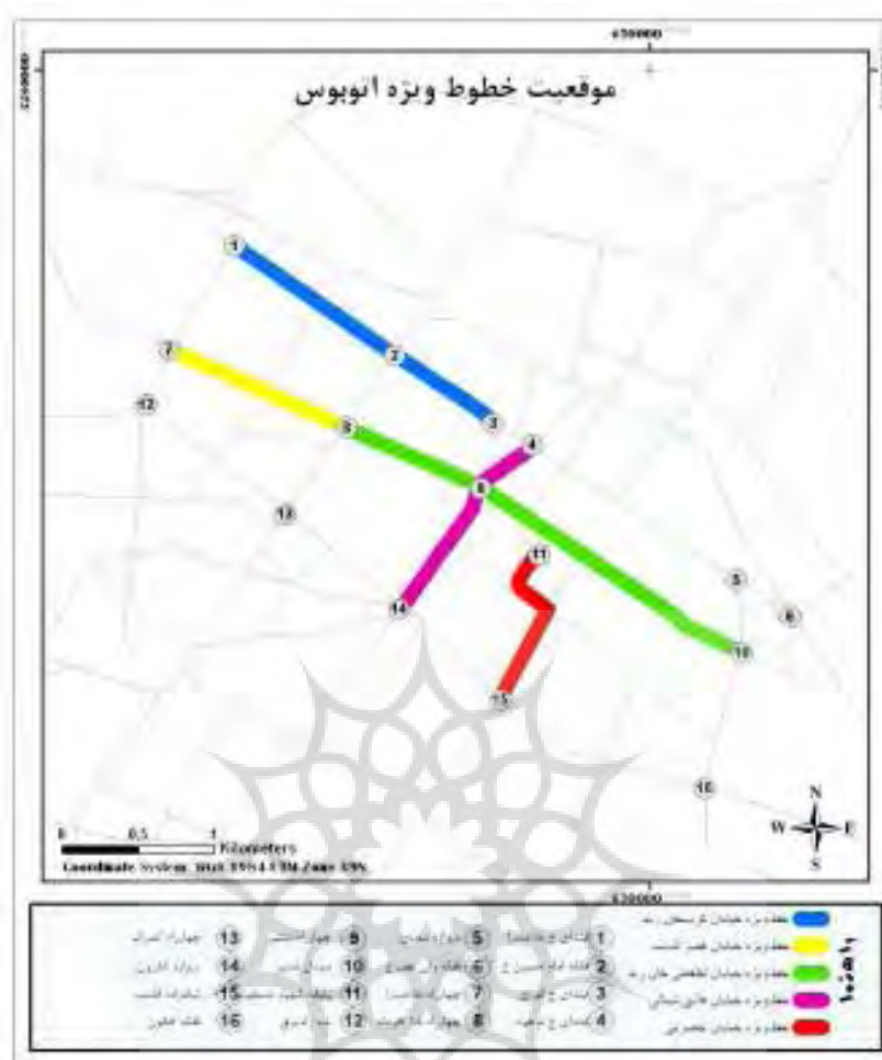
شکل ۱- مسیرهای موجود خطوط ویژه