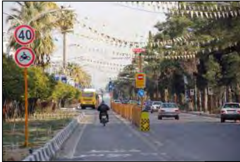
شکل ۲- مسیر ویژه محور کریمخان زند(نمازی - زند)