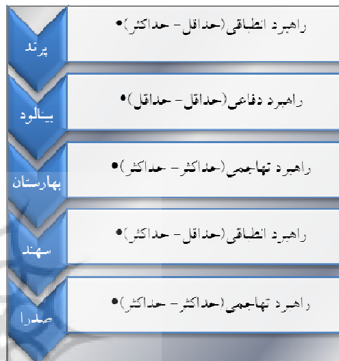
شکل ۲- راهبردهای پیشنهادی برای شهرهای مورد مطالعه

با توجه به نتایج به دست آمده از ارزیابی کمی و میزان موفقیت شهرهای جدید به عنوان شهرهایی پویا و زنده، همچنین راهبردهای چهارگانه این تکنیک و نتایج تحلیلی بدست آمده، متناسب با شرایط هر شهر جدید راهبردهایی به شرح زیر پیشنهاد می‌گردد: