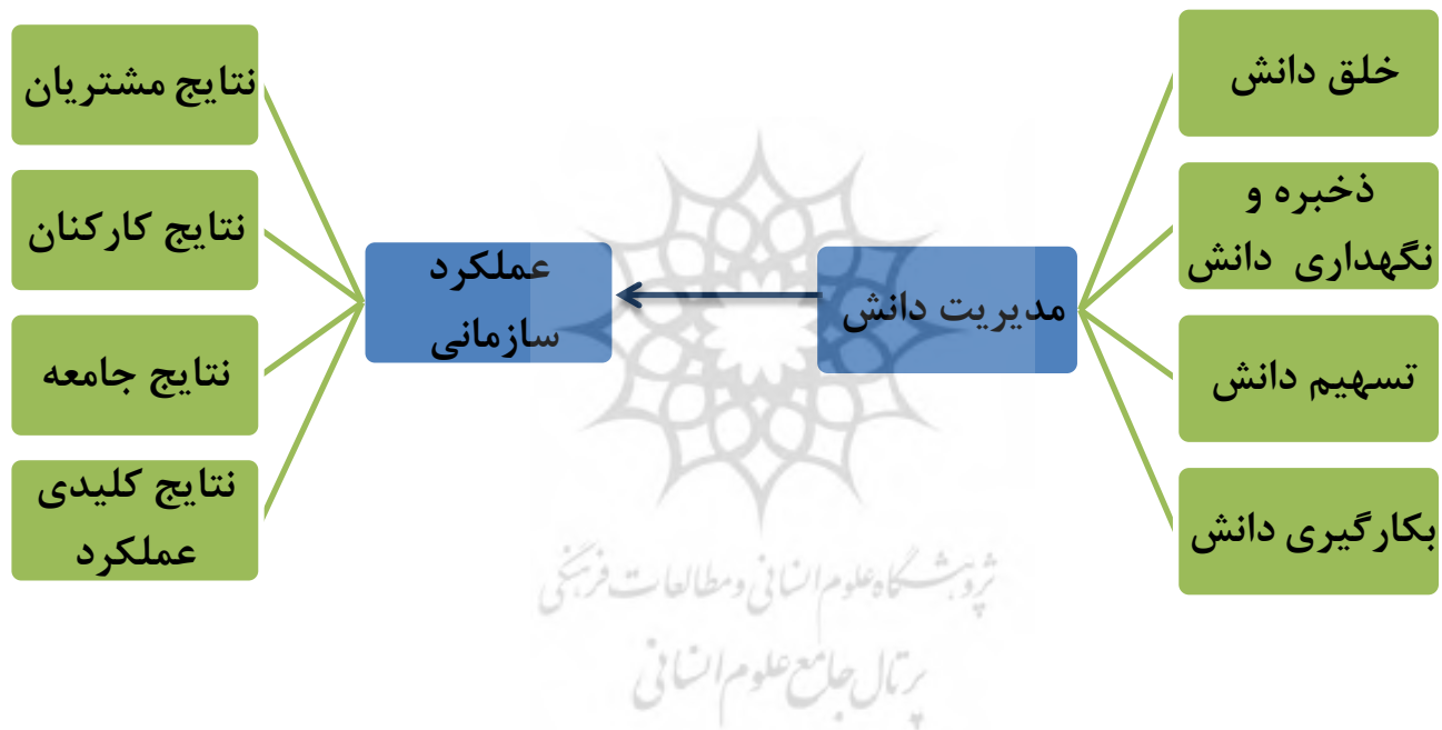
شکل ۲: مدل پیشنهادی تحقیق (Newman & Conurd, 1999، EFQM2003)