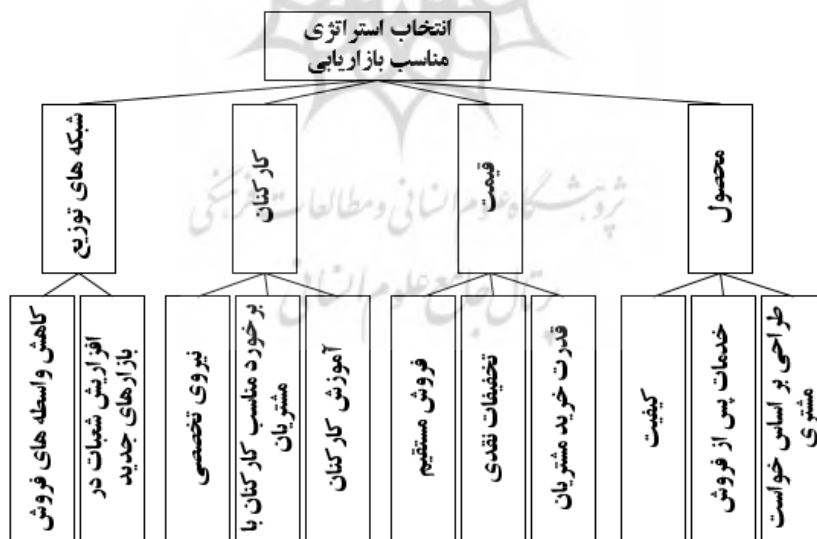
شکل ۹: نمودار سلسله مراتبی عوامل اثر گذار بر انتخاب استراتژی مناسب

با توجه به تحقیقات پیشین، عوامل موثر بر انتخاب استراتژی مناسب در شرایط رکود اقتصادی و استفاده از مفاهیم مربوط به آمیخته بازاریابی، نمودار سلسله مراتبی عوامل اثر گذار بر این امر، تشکیل شد و پس از تصحیح توسط کارشناسان به شکل زیر نشان داده شد.