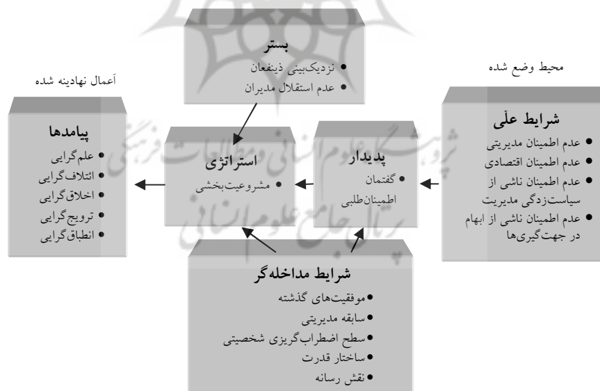
شکل 3 مدل نهایی پژوهش در قالب پارادایم کدگذاری محوری (برخاسته از گام کدگذاری محوری)