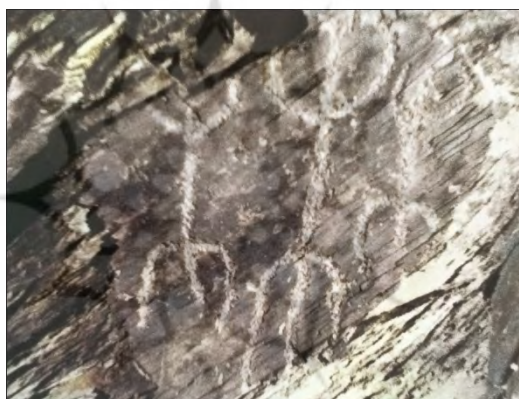
رقص جادویی در محوطه تاریخی تیمره - محل: برگله (فرهادی، ۱۳۷۶: ۲۷۱):