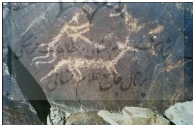
طرح ۱۸- شکارگوزن (محوطه تاریخی تیمره-محل:برگله) (فرهادی، ۱۳۷۶، ۲۴۱)