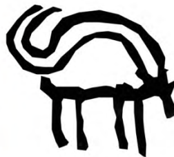
طرح ۱۱- نمونه از نقوش باگلسنگ