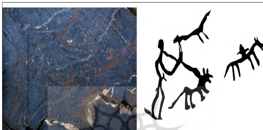
طرح ۱۷- نقش شکار با حضور شکارچی و شکار در صحنه

است. در مجموع، تعداد ۱۵۲ نقش در این محل شناسایی شد که در موارد متعدد، ایجاد نقوش جدید باعث تخریب آثار قبلی شده است