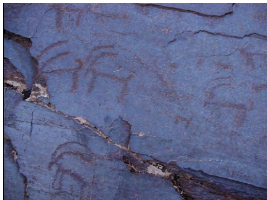
طرح ۱۹- محدوده ۳: نقوش بزرسانان