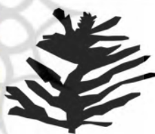
طرح ۱۳- تنها نمونه گیاه و درختی نقوش شناسایی شده در منطقه