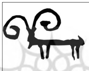
طرح ۱۶- محدوده ۲: شکارگاه (تنها نمونه بز با شاخ‌های پیچ خورده و تمام رخ)