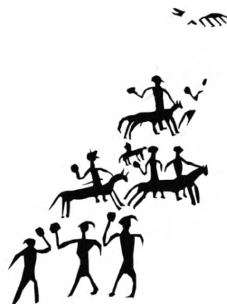
طرح ۲۳- محدوده ۴ (آشاقی نهنجه): صحنه نبرد با نقش جنگجویان کلاه خود به سر، گرز به دست و شمشیر به کمر