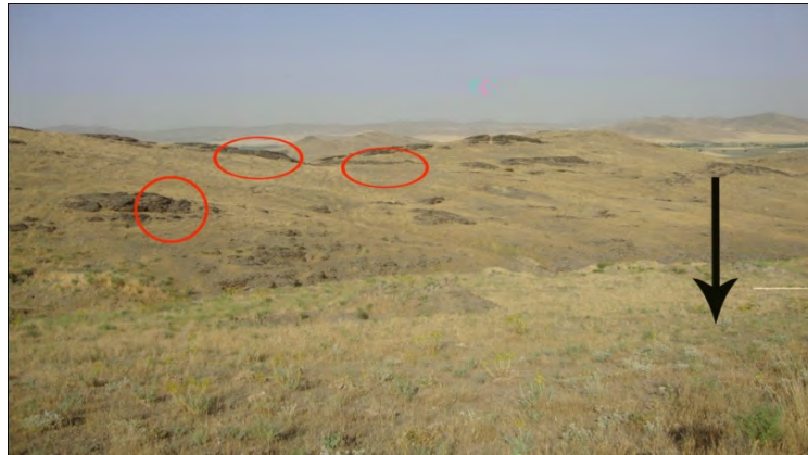
طرح ۲- محدوده ۱: موقعیت نقوش نسبت به تپه باستانی