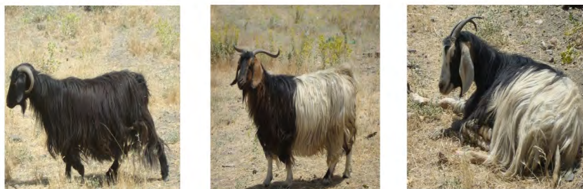
نمونه‌ای از بزهای بومی منطقه از ندریان