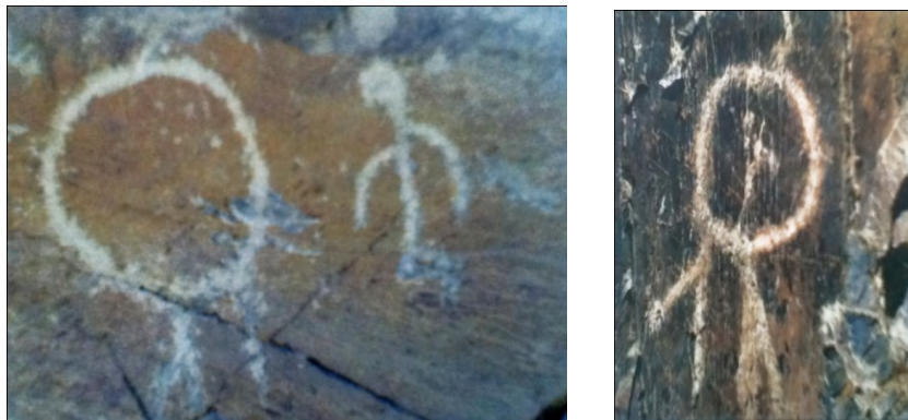
نماد خاص در محوطه تاریخی تیمره - محل: شاه نشین آشناخور (فرهادی، ۱۳۷۶):