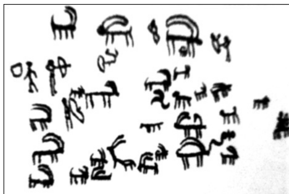
سنگ نگاره‌های ابراهیم آباد اراک (رفیع‌فر، ۱۳۸۴، ۱۰۲)