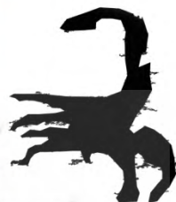
طرح ۱۲- محدوده ۲: شکارگاه (نقش عقرب با دم برگشته به بالا)