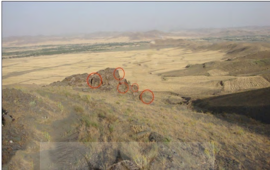
طرح ۶- محدوده ۲ (بقلی دره سی): پراکنش و موقعیت نقوش نسبت به دشت