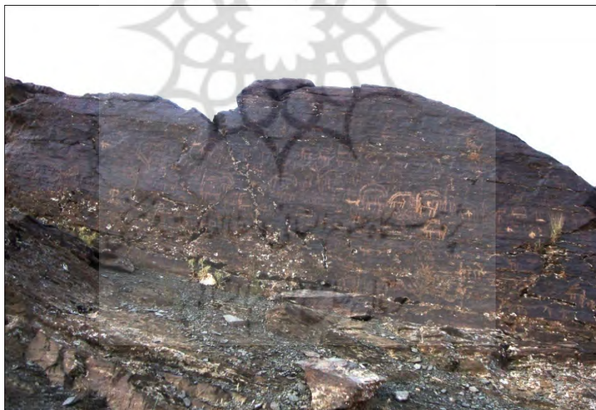
طرح ۷- محدوده ۲ (بقلی دره سی): شکارگاه