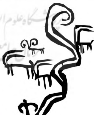
طرح ۱۰- محدوده ۲: شکارگاه (نماد خاص؟ یا رود خانه)