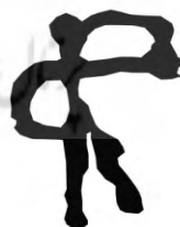
طرح ۱۴- محدوده ۲: شکارگاه (انسانی با شی شبیه کمان به دست)