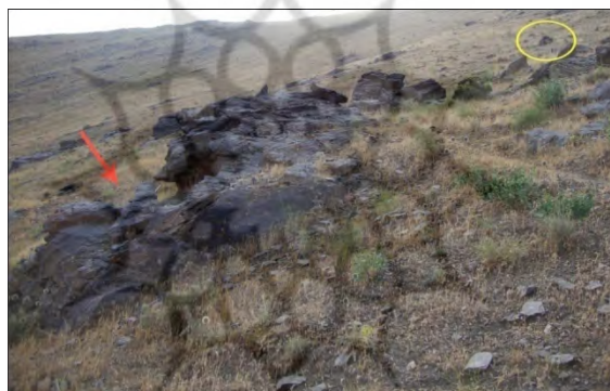
طرح ۲۱- محدوده ۴ (آشاقی نهنجه): موقعیت نقوش نسبت به پناهگاه سنگی

منطقه ۳ از نوع گارنت مگاشیت است. از تفاوت‌های قابل ذکر نقوش منطقه ۴ با نقوش مناطق ۱ و ۲ و ۳ این است که در منطقه ۴، نقوش بز ساسان و گربه سانان در اقلیت و انگشت شمارند؛ در حالی که شاخص‌ترین نقوش این محدوده، سواران و افراد پیاده گرز در دست و کلاهخود به سر، با موضوعی کاملاً روایی است. نقوش این لوح نسبت به سایر نقوش منطقه مورد بررسی، طبیعت‌گرایانه است. از دیگر وجوه اختلاف با سه محدوده دیگر، جهت نقوش است که در این محل، به سمت شرق است. در مجموع، تعداد ۴۶ نقش در این محل، کشف و مطالعه گردید که در این‌جا نیز در موارد متعدد، ایجاد نقوش جدید باعث تخریب نقوش قبلی شده است.