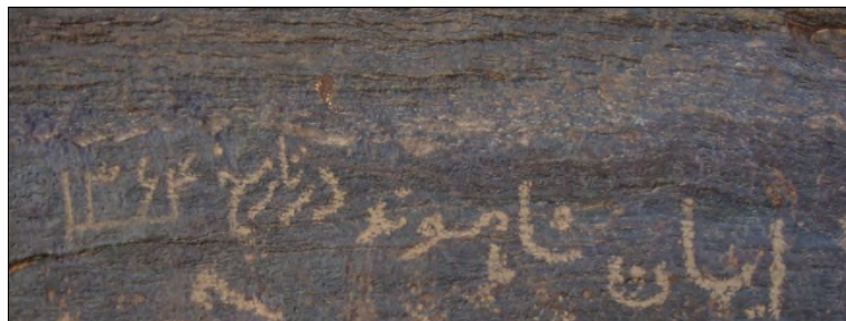
طرح ۱۵- نمونه‌ای از تکرار نقوش توسط چوپانان روستای قشلاق