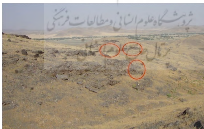
طرح ۱- محدوده ۱ (قشلاق دالی): پراکنش نقوش

محدوده شماره ۱ به جهت مجاورت با روستای قشلاق، با نام محلی (قشلاق دالی) نام‌گذاری شد. در فاصله کمی از این نقوش، زمین‌های دیم کشاورزی آغاز می‌شود. نقوش در کنار دو مسیر فصلی و مسلط به دشت جوکار ایجاد شده‌اند. جنس سنگ‌هایی که نقوش روی آنها حک شده از نوع دگرگونی فلیت و صخره‌ها به صورت صاف و بدون رگه است. زاویه ایجاد نقوش اغلب به سمت جنوب و با چشم اندازی به دشت جوکار است. در مجموع، تعداد ۱۹۷ نقش در این محل شمارش شد که در بیشتر موارد، ایجاد نقوش جدید، باعث تخریب آثار قبلی شده است.