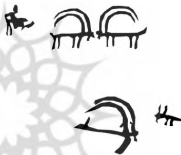
طرح ۹- محدوده ۲: نمونه‌ای از صحنه روایی با موضوع شکار