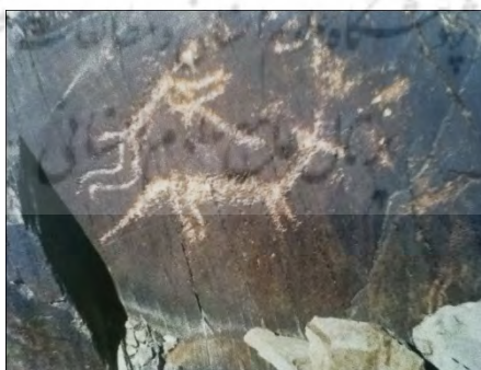
شکارگوزن در محوطه تاریخی تیمره - محل: برگله (فرهادی، ۱۳۷۶: ۲۴۱):