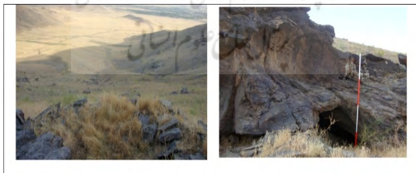
طرح ۲۲- ورودی پناهگاه سنگی و موقعیت پناهگاه نسبت به دشت