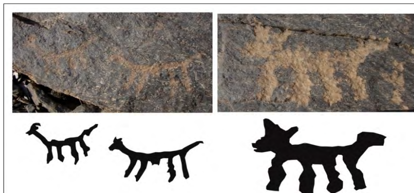
طرح ۵ (۱، ۲) - محدوده ۱: نمونه‌ای از نقوش سگ سانان این محدوده