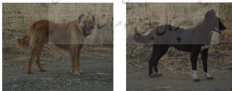
نمونه‌ای از سگ‌های بومی منطقه

این نگاره به صورت تک نگاره یا در صحنه‌های روایی دیده می‌شود. در نگاره‌های منفرد، با بدنی نیم‌رخ و گاهی کشیده با خطوطی استلیزه یا حجیم نمایش داده شده است. در نمایش نگاره‌های این حیوان همانند نگاره‌های بزها عمدتاً حساسیت و دقت خاصی به کار نرفته است. اما در صحنه‌های روایی، جزئی از صحنه به نمایش گذاشته شده است که سگ در خدمت انسان و به صورت اهلی در حال شکار، نمایش داده شده است. با مطابقت نقوش با سگ‌های چوپانان بومی و گله‌های عشایر در حال گذر از منطقه، بیشترین مطابقت با نمونه سگ‌های سیاه با بدنی کشیده و با پاهای نه چندان بلند مشاهده شد که به سگ‌های سرابی و گرگی معروفیت دارند.