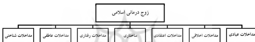
شکل ۲: ساختار مداخلات در زوج‌درمانی اسلامی

و رفتارها بررسی کرد. در الگوی اسلامی دو محور جدید یعنی ساختار خانواده و معنویت به زوج‌درمانی اضافه می‌شود. آموزه‌های اسلامی در سلسله مراتب و مرزها در خانواده با دیدگاه ساخت‌نگر مینوچین هم‌پوشی‌های جالب توجهی دارد (سالاری‌فر، ۱۳۷۹ و ۱۳۸۵). افزون بر این در آسیب‌شناسی روابط زوجین از دیدگاه اسلام، ضعف‌های ساختاری نقش مؤثری دارد. معنویت نیز رکن کلیدی نگاه اسلام به ازدواج و خانواده است (سالاری‌فر، ۱۳۸۵). مداخله‌های معنوی در سه محور اعتقادات، عبادات و اخلاق بررسی می‌شود. شکل ۲ ساختار مداخله‌ها را نشان می‌دهد.