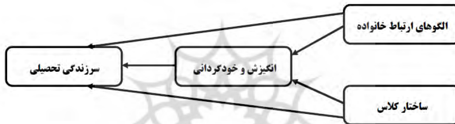
شکل ۱: مدل مفهومی از روابط بین متغیرهای پژوهش