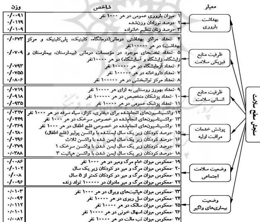
شکل ۲: درخت سلسله‌مراتب معیارهای سلامت و وزن هر شاخص براساس تکنیک ANP

شاخص‌ها در تحقیق حاضر، شامل ۲۷ شاخص در زیرمجموعه ۶ گروه بهداشت باروری، منابع فیزیکی و انسانی، خدمات مراقبت اولیه، شاخص‌های ذیح حیاتی و وضعیت بیماری‌های واگیر است. روش جمع‌آوری اطلاعات، کتابخانه‌ای است و بر پایه داده‌های خام سرشماری عمومی نفوس و مسکن، سال‌نامه‌های آماری و سازمان بهداشت و علوم پزشکی استان در سال‌های ۱۳۸۳ تا ۱۳۸۷ است. یکی از ورودی‌های مهم مدل الگتره، وزن شاخص‌هاست که در این تحقیق با استفاده از مدل فرآیند تحلیل شبکه‌ای ANP به کمک نرم‌افزار Super Decision وزن شاخص‌ها به دست آمده است. فرآیند تحلیل شبکه‌ای هر مسأله‌ای را به مثابه شبکه‌ای از معیارها، زیرمعیارها و گزینه‌ها، که با یکدیگر در خوشه‌هایی جمع شده‌اند، در نظر می‌گیرد. تمامی عناصر، در یک شبکه می‌توانند دارای ارتباط متقابل با یکدیگر باشند (زبردست، ۱۳۸۸: ۸۰). وزن شاخص‌های پیشنهادی نیز به وسیله ۱۳ نفر از کارشناسان مرتبط تعیین شده است و به هر شاخص اختصاص داده شده است. شکل ۲ مدل ANP ارتباط بین معیارها و شاخص‌های مربوط به این پژوهش، را که در نرم‌افزار Super Decision ترسیم شده است، نشان می‌دهد.