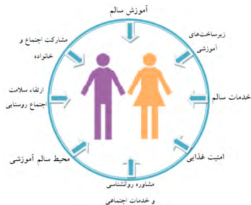
شکل ۴: فاکتورهای تبیین‌کننده محیط سالم برای بهبود کیفیت زندگی

مأخذ: Department of Environmental Planning, 2009: 45