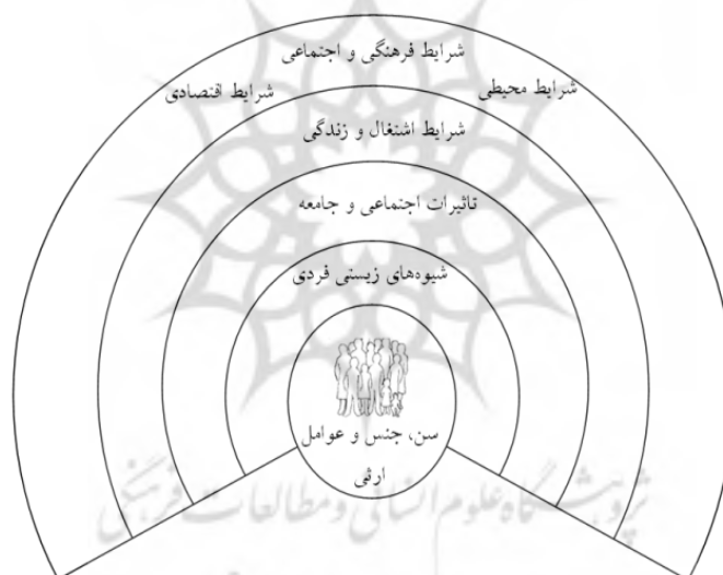
شکل ۳: فاکتورهای تعیین‌کننده سلامت

و ژنتیکی، بلکه از طریق مجموعه‌ای از عوامل اقتصادی، محیطی و اجتماعی نیز تعیین می‌شود (Pilkington, 2002: 157). در این راستا، بارتون و همکاران (۲۰۰۴) فاکتورهای مؤثر بر سلامت را در الگوی «تعیین‌کننده‌های محلی سلامت»، به صورت لایه‌های متداخل و تأثیرگذار بر هم، ترسیم می‌کنند. به اعتقاد آن‌ها در لایه اول سلامتی و تندرستی و کیفیت زندگی افراد قرار دارد. در لایه دوم، عوامل مؤثر بر سرمایه اجتماعی (حمایت و همکاری اجتماعی) تحلیل می‌شود. در لایه سوم نیازهای یک فعالیت شامل خدمات و امکانات کار قابل دسترس، موضوع تحلیل است. در لایه چهارم فشار و تأثیرات پروژه‌های توسعه، نظیر تأثیر بر جامعه و سلامتی و کیفیت زندگی مردم، تحلیل می‌شود. و در لایه پنجم ردپای اکولوژیکی یک محله یا شهرک تحلیل می‌شود (Barton, et al., 2004: 11-12 & 85) (شکل ۳).