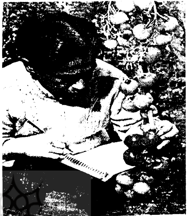
جدول ۳. روند رشد فعالیت در تعاونیها

در طی ۳۶ سال گذشته، دولت و تعاونیهای کشاورزی به عنوان همکاران شایسته برای تسهیل فرایند توسعه اقتصادی اجتماعی کشور کره به میزان زیادی برای کشاورزان و جوامع روستایی کار کرده اند. دولت بسیار نیاز داشت که تعاونیها به عنوان یک مؤسسه روستایی برای اهداف توسعه مطرح باشند. در همان زمان تعاونیها مساعدتهای مورد نیاز بیشتری را از دولت برای فعالیتهایشان، خصوصاً در مدت زمان تکوینشان، طلب می کردند. به راستی در این ایام رابطه آنها یک نوع همزیستی متقابل بود، به مصداق این جمله که: «من پشت تو را می خارانم، تو هم پشت مرا بخاران!» دولت بهترین استفاده را از تعاونیهای کشاورزی به عنوان عاملان اجرای برنامه ها و سیاستهای توسعه برد و بدین ترتیب تعاونیها نیز به منابع اقتصادی قابل توجهی در زمینه امتیازهای مالیاتی، تعهدات و