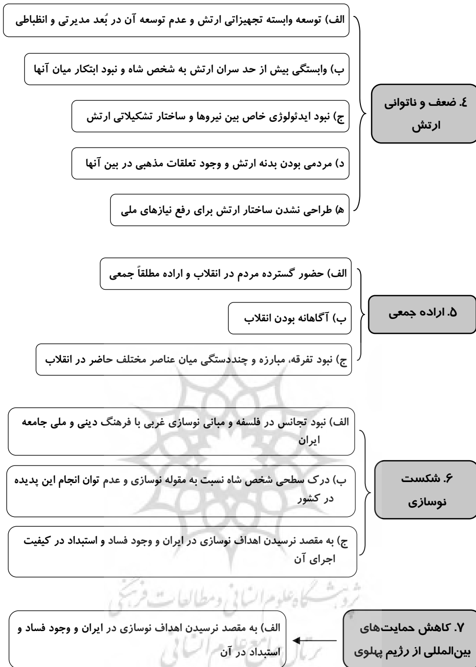
شکل (۲) عوامل مؤثر در شکل‌گیری و وقوع انقلاب اسلامی از دیدگاه میشل فوکو