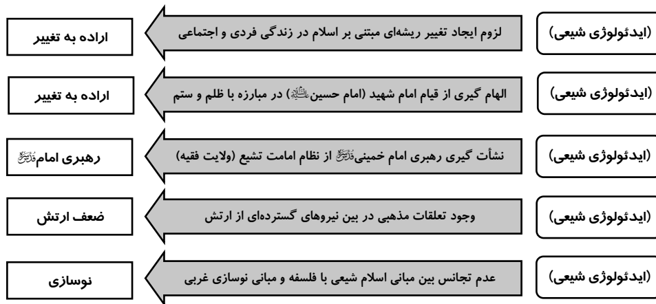
شکل (۳) چگونگی تأثیر «ایدئولوژی شیعی» بر سایر عوامل مؤثر در شکل‌گیری و پیروزی انقلاب اسلامی