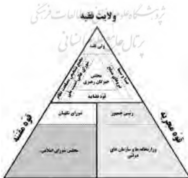
شکل ۲. توزیع قدرت در قانون اساسی ۱۳۶۸

در قانون اساسی، اصول مربوط به انتخابات و مجلس شورای اسلامی (۶۲-۹۰) در مقابل اصول مربوط به شورای نگهبان (۹۱-۹۹) و ولایت فقیه (۱۰۹-۱۱۰)، مختصات ویژه‌ای از سلسله مراتب قدرت را شکل می‌دهد که از ویژگی‌های آن جایگاه ثانوی پارلمان و انتخابات به عنوان مظهر حاکمیت ملی در مقابل جایگاه ولایت فقیه به عنوان مظهر حاکمیت الهی و خصلت ابزاری نهادهای دموکراتیک در تثبیت بنیاد اصلی نظام سیاسی است. مجلس با همه اقتدار و نفوذی که بر قوای دیگر دارد و با وجود صلاحیت در وضع قوانین و نظارت بر دستگاه‌ها و مقامات عالی‌رتبه اجرایی بدون وجود شورای نگهبان اعتبار قانونی ندارد (اصل ۹۳). همچنین نظارت استصوابی باعث می‌شود تا مجلس نتواند به عنوان محلی برای نمود اراده عمومی مطرح شود؛ زیرا تمام امور انتخاباتی زیر نظر و با صلاح دید شورای نگهبان اعتبار می‌یابد. این صلاح دید یا مصلحت‌اندیشی می‌تواند ابتکار عمل شورای نگهبان را تا آن حد بالا ببرد که آنچه را صلاح می‌داند تأیید کند و آنچه را صلاح نمی‌داند تأیید نکند؛ به عبارت بهتر در مراحل انتخاباتی دخل و تصرف نماید (هاشمی، ۱۳۸۶: ۲۵۹). در نتیجه بین مجلس شورای اسلامی به عنوان نهادی که طبق قانون اساسی، نماد حاکمیت مردم است و فقهای شورای نگهبان به عنوان پاسداران حاکمیت دینی، رابطه‌ای طولی برقرار می‌گردد (جوان آراسته، ۱۳۸۳: ۱۵۵) و مجلس به عنوان سیمایی از جمهوریت نظام باید خود را با اسلامیت آن هماهنگ نماید. در مجموع می‌توان گفت در نتیجه بازنگری قانون اساسی، جایگاه مجلس در سلسله مراتب قدرت تقلیل یافت. شکل ۲ موقعیت نهادهای قانون اساسی را در هرم قدرت نشان می‌دهد.