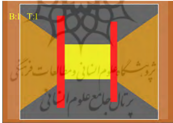
شکل ۳- نمای عملیاتی دستگاه ادراک عمق

پژوهش مورد نظر از نوع نیمه‌تجربی بوده که آزمودنی‌های آن را ۷۲ نفر دانشجوی ورزشکار شرکت‌کننده در دهمین المپیاد ورزشی دانشگاه‌های کشور با دامنه‌ی سنی ۱۹-۲۶ سال ( \pm ۱/۹۸ ) تشکیل می‌دهند. آزمودنی‌های این پژوهش از ۲ نوع رشته‌های ورزشی مختلف شامل رشته‌های توپی (به‌نوعی با توپ درگیرند) و غیرتوپی (رشته‌هایی که بدون توپ یا ابزار اجرا می‌شوند) به نسبت مساوی به‌صورت نمونه‌گیری در دسترس انتخاب شدند. ابزارهایی که برای جمع‌آوری داده‌های پژوهش مورد استفاده قرار گرفت، شامل آزمون تیزبینی اسنلن و آزمون ۶ برگی کوررنگی ایشیهارا و هم‌چنین دستگاه ادراک عمق، رنگ و شکل مدل D9009 بود (شکل ۳).