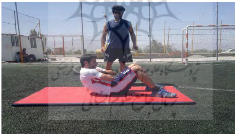
شکل ۱. آزمون فلکسورهای تنه

برای تست استقامت عضلات فلکسور تنه، آزمودنی به صورتی روی تخت می‌نشست که پشت وی به یک تکیه‌گاه که با سطح افق زاویه ۶۰ درجه داشت، تکیه کرده و دست‌های وی به صورت ضربدری روی قفسه سینه بود، زانوها نیز کاملاً خم بوده و کف پاها روی تخت قرار داشت. انگشتان پا توسط نوار ثابت می‌شدند. با شروع آزمون تکیه‌گاه به اندازه ۱۰ سانتیمتر به عقب کشیده می‌شد تا فرد به آن تکیه نداشته باشد. سپس از فرد خواسته می‌شد تا این وضعیت را تا زمانی که می‌تواند حفظ نماید. رکورد فرد از لحظه‌ای که بدن از تکیه‌گاه جدا می‌شد تا زمانی که مجدداً با آن تماس می‌یافت، ثبت می‌شد. (شکل ۱).