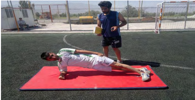
شکل ۳. آزمون لترال فلکسورهای تنه

برای تحلیل آماری از نرم افزار اس.پی.اس.اس نسخه ۱۱/۵ (version 11.5, SPSS Inc., Chicago, IL) استفاده شد. با توجه به نرمال بودن توزیع داده‌ها که توسط آزمون کولموگروف - اسمیرنوف مشخص شد، جهت مقایسه دو گروه از آزمون تی مستقل استفاده گردید. سطح معناداری کمتر از ۰/۰۵ در نظر گرفته شد.