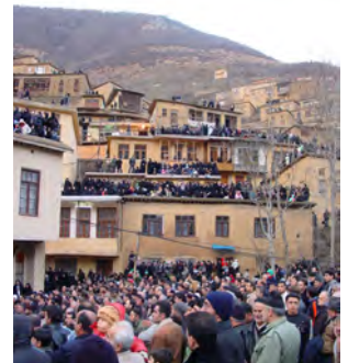
تصویر ۹: مراسم آیینی علم‌بران در طبقات بافت. عرض کم معابر برای حرکت دستجات عزاداری (پایگاه ماسوله)

جدول ۱: شرایط حداقلی صدور مجوز تالارپیش در ماسوله