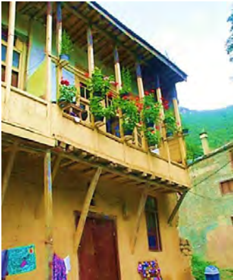
تصویر ۴: تالارپیش (پایگاه ماسوله)

ایجاد تالارپیش از سوی اهالی وجود دارد. برای ماسوله‌ای، کلیت مکان به راحتی نمی‌تواند دستخوش تغییراتی حتی به‌ظاهر محدود در حد الحاق تالارپیش برای خانه‌های تاریخی باشد.