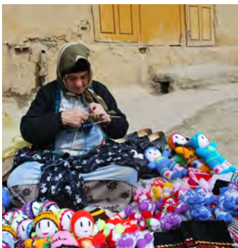
تصویر ۶: نشستن زنان در حدود همسایگی (پایگاه ماسوله)