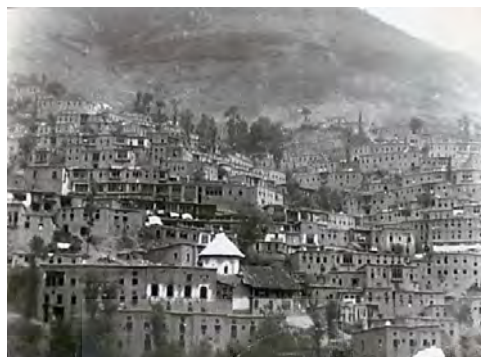
تصویر ۲: ماسوله؛ درهم‌تنیدگی بافت و بروز قلمروهای تفاهمی ویژه در آن (پایگاه ماسوله)

(حبیبی ۱۳۸۲). شکل ارگانیک مسیرها در بافت‌های تاریخی بر خلاف ساختار گذربندی شهرهای معاصر، ۳۳ عموماً با رضایت‌مندی ساکنان مکان، سامان گرفته و دست‌کم تغییرات محلی آن بدون رضایت و توافق ساکنان مسیر نبوده است. نمونه‌های بی‌شمار این امر را می‌توان در عبور مسیرهای دسترسی عمومی در میان عرصه‌های با مالکیت خصوصی مشاهده کرد. ۳۴