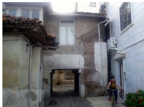
تصویر ۱: لنگرود؛ عبور گذر عمومی از میان عرصه در مالکیت خصوصی