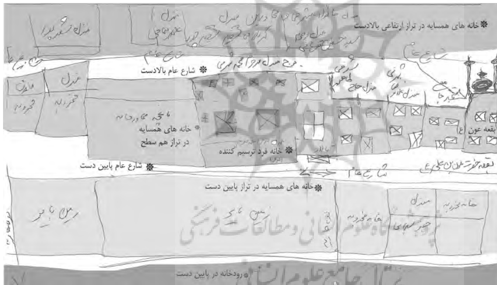
تصویر ۷: نقشه ذهنی یک شهروند ماسوله‌ای از حدود همسایگی خانه‌اش در سه تراز ارتفاعی

در ماسوله به سان هر شهر تاریخی، هر خانه با چند خانه مجاور خود، حدی را تعریف می‌کند که می‌توان آن را قلمرو همسایگی عنوان کرد؛ با این توضیح که بررسی نقشه‌های ذهنی ترسیم‌شده توسط اهالی در این خصوص، نشان می‌دهد این نوع قلمرو دست‌کم در سه سطح و تراز ارتفاعی بروز می‌یابد. این سه سطح ناشی از اشتراک در چشم‌انداز بصری، شنیداری و دسترسی است. ۵۲ بدین رو که هر خانه با چند خانه مجاور خود در سه تراز طبقاتی بافت که از طریق بازشوها دارای افق بصری یکسان یا دسترسی فرعی مشترک‌اند، همسایگان را شکل می‌دهند. این محدوده برای هر خانه شامل خانه‌های طبقه بالا، طبقه پایین و البته طبقه هم‌تراز بنا (سه تراز طبقاتی در بافت) دارای شأنیت است. ۵۳