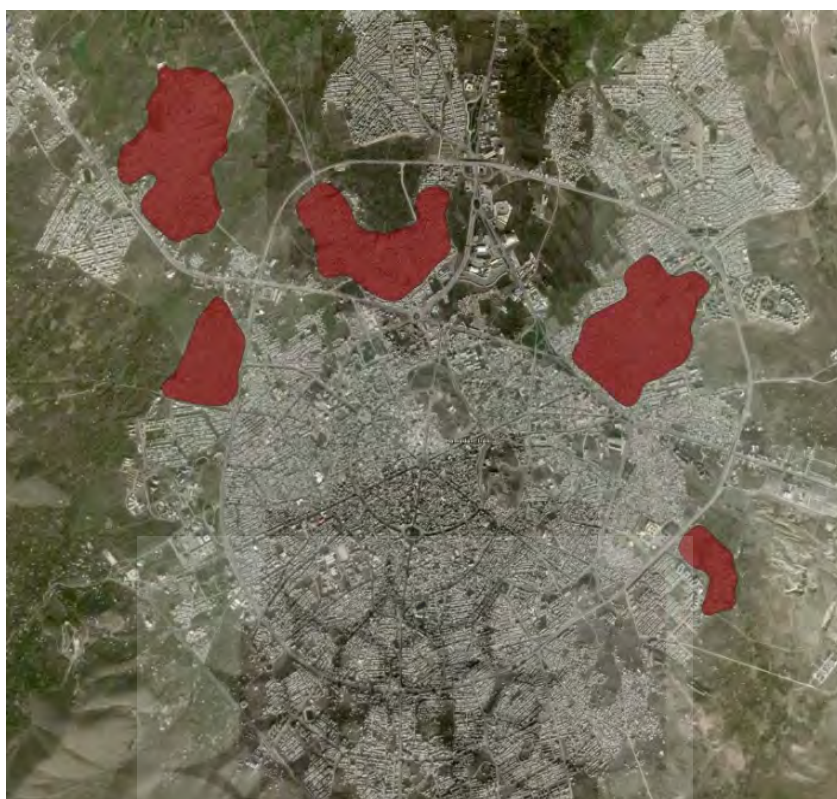
شکل ۱: موقعیت سکونتگاه‌های غیررسمی در شهر همدان