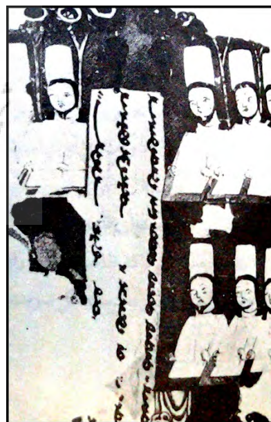
۴- خوشنویسان مانوی (نگاره مینیاتوری)