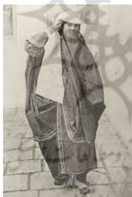
۱۱- چادر نواردوزی شده

در زمان آقا محمد خان قاجار و فتحعلیشاه زنان همچنان از چادر سفید و بر روی آن از روبنده استفاده می‌کردند. دروویل؛ چادر زنان ایرانی در زمان فتحعلی شاه را چنین توصیف می‌کند. «زنان به هنگام خروج از خانه خود را در چادری از قماش نخی سفید دوخته شده که دامن آن گرد است می‌پوشانند. با قیطانی چادر را بر سر و یا گردن محکم کرده و صورت خود را با پارچه‌ای به نام روبند می‌پوشانند. روبند پارچه نخی چهارگوشی است که با دو قلاب کوچک در بالای پیشانی به دستار می‌چسبند. در میان روبند شکاف درازی باز کرده و آن را توردوزی می‌کنند. زنان هنگام خروج از خانه چکمه‌های پارچه‌ای بلندی که تا بالای زانومی رسد به پا می‌کنند. شلوار آنها نیز درون این چکمه‌های پارچه‌ای قرار می‌گیرد.» (شریعت پناهی؛ ۱۳۷۲: ۸۶) منظور دروویل از چکمه پارچه‌ای همان چاقچور است. چاقچور شلوارگشادی بود که جوراب دوخته شده‌ای به آن متصل می‌شد و به وسیله بند جوراب دور پا نگه داشته می‌شد. چاقچور قسمت دوم حجاب بیرونی زنان به شمار می‌رفت. «رنگ چاقچور را بنفش و آبی تند و سینه کفتری انتخاب می‌کردند و زنان سیده چاقچور سبز می‌پوشیدند. ولی چاقچور سیاه در بین بانوان مجلل تر و متین تر محسوب می‌شد و گاهی آن را از خارا ۱ و قنایز ۲ و مخمل می‌دوختند.» (ذکاء؛ ۱۳۳۶: ۳۲) استفاده از چاقچور از زمان آقا محمد خان قاجار در میان زنان متداول شد و تا اواخر سلطنت ناصرالدین شاه ادامه پیدا کرد. در همان اواخر سلطنت ناصرالدین شاه است که خانم کارلاسرنا از چاقچورهایی از چلوار سبز؛ بنفش و خاکستری و قرمز نیز نام می‌برد؛ که در بین زنان رایج بوده است.