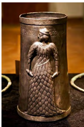
۱- جام مرو دشت؛ دوره کهن موزه ایران باستان

در دوره ایلام میانه نقش زنان همچنان در میان آثار آن دوره وجود دارد. نقش برجسته خدا بانو و گاومردی که به درخت نخل تکیه داده و به همراه کتیبه ایلامی از مجموعه آجرهای تزیینی معبد خدای اینشوشیناک شوش بدست آمده و قدمت آن ۱۲۰۰ ق م است. «محمد پناه؛ ۱۳۸۶؛ ۴۰ - ۲۹» همچنین الهه های باروری و نماد های زنانگی در هزاره دوم ق م در دوره میانه ایلام باز هم دیده می شود. از دوره ایلام جدید به تدریج حضور ایزدان مذکر بیشتر می شود و کم کم حضور زنان و الهه گان محدودتر می شود. بر روی نقش برجسته ایلامی دیگری زنی اشرافی در حال نخ ریزی؛ متعلق به سده ۹ ق م است که موهای خود را به سبک آرایش زمانه خود با نوارهای تزیینی آراسته است. به نظر می رسد پوشاندن مو داشتن پوششی که از سر تا پا را فراگیرد؛ چندان در میان زنان ایلامی متداول نبوده است.