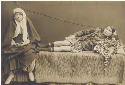
۱۳- تضاد سنت و مدرنیته در دوره ناصرالدین شاه

رنگ های آبی؛ قهوه ای و سفید به عرض دو انگشت در اطراف چادر مشکی معمول گردید. سابقاً جلو چادر مشکی را بندی می دوختند که هنگام سر کردن چادر آن را به گردن می انداختند ولی بعد ها بند را به قسمت جلو چادر دوخته و دوسر آن را آزاد می گذاشتند که هنگام سر کردن آن را در پشت کمر محکم می کردند. چادر های عبایی که از بغداد آورده می شد بسیار گرانبها و مخصوص زنان اعیان و اشراف بود. (ذکاء؛ ۱۳۳۶: ۳۱)