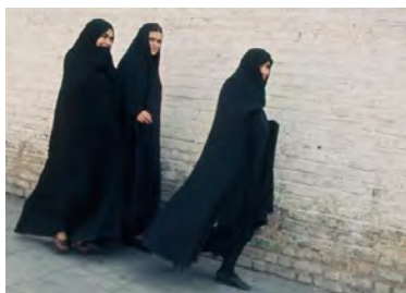
۱۴- چادر و پیچه در دوره مشروطیت