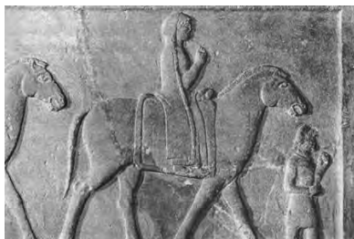
۳- نقش برجسته زن با چادر موزه تاریخ باستان استانبول

نمونه های پراکنده ای از پوشش زنان در آثار هخامنشیان وجود دارد که نشان می دهد لباس آنان شباهتی به لباس زنان ایلامی ندارد. در بررسی آثار هخامنشیان به نکته قابل توجهی پی می بریم و آن پوشاندن سر و استفاده از چادر به منظور پوشاندن کامل اندام است. پوشش زنان سر تا پای آنان را در بر می گرفت و مردان برای پوشاندن سر از کلاه استفاده می کردند. « یک نمونه از پوشش زنان در آسیای صغیر در هنگام کشف یک نقش برجسته در حوالی داسیلیون ارگیلی پایتخت قدیمی ساتراپی فریجیه متعلق به هخامنشیان؛ پدیدار شد. این نقش برجسته بقایای دسته ای از ملتزمان رکاب وزنان و مردانی بر پشت قاطرهاست. این نقش در حال حاضر در موزه استانبول در ترکیه نگهداری می شود. این قطعه باقیمانده؛ زنی را بر پشت یک قاطر نشان می دهد که دارای یک چادر بلند است.» (پور بهمن؛ ۱۳۸۶: ۷۶)