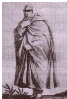
۹- زن ایرانی از سفرنامه تاورنیه

سیاح دیگر تاورنیه بود که در فاصله زمانی حکومت شاه صفی تا شاه سلیمان در ایران به سر می برده است؛ او در مورد حجاب زنان باز هم به حجاب بلند سفیدی به نام چادر اشاره می کند که روی همه ملبوسات خود می پوشند و از سر تا پا بدن و صورتشان را مستور می کند و دستمالی بر صورت می نهند که در مقابل چشمانشان شبکه توری تعبیه شده است. شاردن فرانسوی هم از چادر سفیدی نام می برد که زنان هنگام بیرون رفتن از خانه از آن استفاده می کنند. روبنده سفید یا نقابی سیاه بافته شده از موی اسب هم بر روی چادر بر سر نهاده می شد. اینگونه استفاده از چادر سفید همچنان در زمان کریم خان زند نیز معمول بوده است. به نقل از یحیی ذکاء در دوره زند است که به جز چادر سفید «زنان چادرسیاه یا بنفش یا نیلی تند به سر می کردند و روی خود را محکم می گرفتند.» (ذکاء؛ ۱۳۳۶: ۱۲)