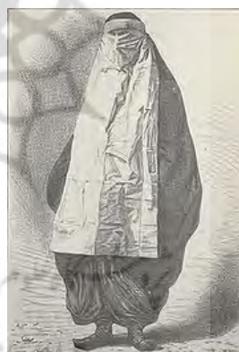
۱۰- چاقچور و روبند

بر طبق نوشته‌های اولیویه زنان عادی که زندگی خالی از تکلفی داشته‌اند؛ از چادرهای تنگ کرباس راه راه آبی سفید استفاده می‌کردند که با یک دست آن را جمع و بادیست دیگر صورت خود را می‌پوشانند. در دوره محمد شاه تغییراتی در لباس ایرانیان پیدا شد اما زنان دیگر از چادرهای سفید در خارج از خانه استفاده نمی‌کردند؛ چادرها به رنگهای سیاه یا بنفش بود اما روبند سفید برای پوشانده صورت مانند گذشته همچنان معمول بود. «به طور کلی پوشش اصلی زنان دوره اول و دوم قاجاریه در خارج از خانه چادر سفید بود و انواع گوناگون داشت که عبارت بود از چادر نماز چیت؛ کرباس؛ مخمل و اطلس و یا چادر کرباس چهارخانه که به رنگ‌های آبی و قهوه‌ای که آن را چادر شب هم می‌گفتند.» (غیبی؛ ۱۳۸۴: ۵۹۸) چادر شب در روستاها به کار برده می‌شد و آن را به شکل مربع می‌بریدند و روی سر قرار می‌دادند و روبند را به آن می‌بستند. اینگونه چادرشبه‌ها همچنان در میان زنان اقوام ایرانی مرسوم است. «چادر سیاه یا بنفش ریشه دار پنبه‌ای یا ابریشمی که در یزد بافته می‌شد بسیار با دوام بود. زنان اعیان و بزرگان اطراف این چادرهای سیاه را با گلابتون دوزی و حاشیه نقره‌ای تزیین می‌کردند. بعدها این کار منسوخ شد و به جای آن حاشیه سر خود به