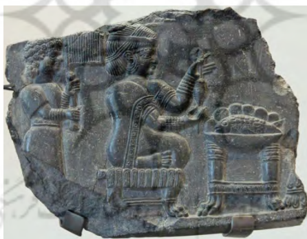
۲- بانوی ریسنده دوره جدید؛ موزه لوور

در دوره ایلام میانه نقش زنان همچنان در میان آثار آن دوره وجود دارد. نقش برجسته خدا بانو و گاومردی که به درخت نخل تکیه داده و به همراه کتیبه ایلامی از مجموعه آجرهای تزیینی معبد خدای اینشوشیناک شوش بدست آمده و قدمت آن ۱۲۰۰ ق م است. «محمد پناه؛ ۱۳۸۶؛ ۴۰ - ۲۹» همچنین الهه های باروری و نماد های زنانگی در هزاره دوم ق م در دوره میانه ایلام باز هم دیده می شود. از دوره ایلام جدید به تدریج حضور ایزدان مذکر بیشتر می شود و کم کم حضور زنان و الهه گان محدودتر می شود. بر روی نقش برجسته ایلامی دیگری زنی اشرافی در حال نخ ریزی؛ متعلق به سده ۹ ق م است که موهای خود را به سبک آرایش زمانه خود با نوارهای تزیینی آراسته است. به نظر می رسد پوشاندن مو داشتن پوششی که از سر تا پا را فراگیرد؛ چندان در میان زنان ایلامی متداول نبوده است.