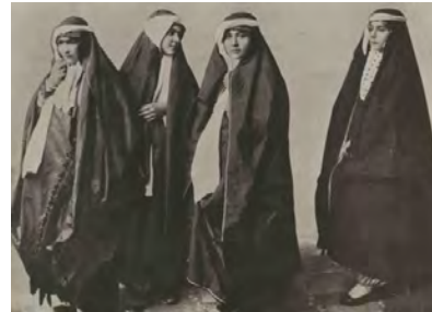
۱۲- چادر عبایی

در ابتدای حکومت ناصرالدین شاه طبق اظهارات دکتر ویلز زنان چادری آبی و یک تکه بر سر می کردند و روبندی صورتشان را می پوشانده است. خانم کارلاسرنا رنگ چادر زنان را سرمه ای تیره می داند. هانری بایندر در اواخر حکومت ناصرالدین شاه به ایران آمده بود. وی در مورد چاقچوری که زنان در خارج از خانه می پوشیدند می گوید: «زنها در کوچه شلواری گشاد که تمام شلیته ها را داخل آن می کنند؛ می پوشند. این شلوار انتهایش به جورابی دوخته شده که داخل کفش می شود. بر روی سر چادری از جنس پنبه ای به رنگ آبی و بر روی چادر روبندهای سفید که در مقابل چشمانشان شبکه ای به شکل ابریشم دوزی تعبیه شده است.» (بایندر؛ ۱۳۷۰: ۱۱۳) تا اواسط دوران سلطنت ناصرالدین شاه استفاده از چادری به رنگ آبی تیره مورد استفاده زنان بود و در میان زنان متوسط و پایین جامعه آن روزگار؛ پارچه چادر از کرباسی بود که آن را با نیل به رنگ آبی در آورده بودند.