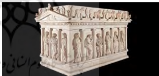
۴- تابوت سنگی موزه تاریخ باستان استانبول

در تصاویری که از بانوان سلطنتی هخامنشی و ملازمان آنان در مجموعه پازریک کشف شده است نیز استفاده از این چنین پوشش چادر مانند دیده می شود که تاجی را نیز بر آن نهاده اند. همچنین در مهر بسیار ظریفی که در موزه لوور موجود است ملکه ای بالباس و چادر هخامنشی و تاج بر مسند شاهانه تکیه زده و در مقابل او ندیمه ای بدون کلاه با موهای بافته ایستاده است. این چنین به نظر می رسد که داشتن چادر نوعی تشخیص در میان زنان درباری محسوب می شده است.