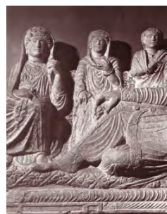
۷- پیکره‌های تدفینی پالمیرا؛ موزه دمشق