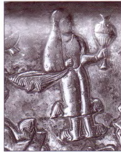
۸- نقش زن بر روی ظرف نقره دوره ساسانی

دردوران ساسانی عناصر اصلی تن پوشها همان است که در زمان اشکانیان متداول بوده است. در آثار این دوره بیشتر به پارچه ها و نقوش آنها پرداخته شده تا جزییات لباس. «زنان تن پوش بلند با آستین و یا بدون آستین بر تن داند و حجایی نیز که بر شانه چپ حائل شده آن را تکمیل کرده است.» (بوسایلی؛ ۱۳۷۶: ۸۲) چادر برای زنان ساسانی از عناصر مهم پوشش تن و سر بوده است که به صورت گوناگون آن را مورد استفاده قرار می دادند و گاهی به دور کمر می بستند. می شود اینطور نیز قضاوت نمود که چادر در میان زنان این دوره کاربردهای زیبا شناسانه ای نیز داشته است.