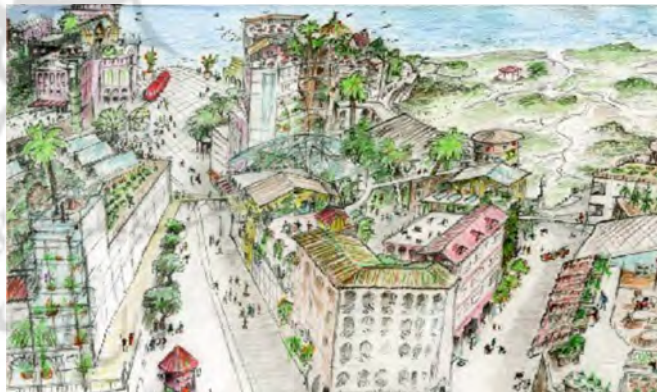
تصویر ۲. طرح از بوم‌شهر ترسیم شده توسط ریچارد رجیستر، مأخذ: Register, 2006: 57

به یک اندازه حق حیات دارند" (Register, 2006: 12). وی تعریف خود را به صورت طراحی شاکلۀ مطلوب بوم‌شهر به تصویر می‌کشد. تصویر ۲ نمونه‌ای از این طرح‌ها است. رجیستر در مجموع شاخصه یک بوم‌شهر را در پانزده مورد بیان می‌کند که شامل دسترسی بر مبنای مجاورت، هوای تمیز، خاک سالم، آب سالم و تمیز، منابع و مواد پاسخگو، انرژی پاک و تجدیدپذیر، غذاهای سالم و در دسترس، فرهنگ سالم، ساخت ظرفیت‌های اجتماعی سالم و مشارکت، اقتصاد سالم و عادلانه، تحسیلات مادام‌العمر، کیفیت زندگی، تنوع زیستی سالم، ظرفیت برد زمین و یکپارچگی بوم‌شناسانه می‌شود (Ecocitybuilders, 2013). او برای هر یک از این شاخصه‌ها معیارهایی تعیین می‌کند. معیارهای مربوط به شاکلۀ بوم‌شهر از دیدگاه رجیستر مستخرج از این شاخصه‌ها عبارتند از: - کاربری مختلط و اختلاطی از مساکن جمعی و خصوصی - بافت فشرده و مرکز محور به نحوی که بیشتر نیازها در فاصله قابل پیاده‌روی و دوچرخه‌سواری تأمین شود. - شاخص بودن شبکه‌های حمل و نقل پیاده، دوچرخه، ریلی و حمل و نقل عمومی در تمامی نقاط شهر - افق دید واضح و رنگ‌های شفاف در روزی آفتابی - آسفالت‌زدایی، برداشتن آسفالت از فضای عمومی به منظور جایگزین کردن فضای سبز، پارک و درخت - استفاده از شیوه‌های کاشت و گونه‌های گیاهی بومی، باغ‌سازی