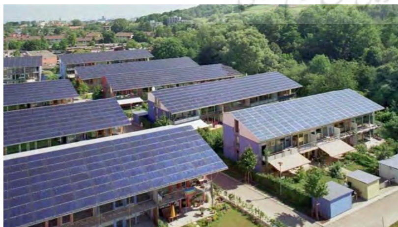
تصویر ۵. نمونه اجرا شده بوم‌شهر در فنلاند. مأخذ: Gaffron, 2005:105.

تجزیه و تحلیل معیارهای شاکله بوم‌شهر از دیدگاه نظریه‌پردازان مختلف، معیارهای مشترکی را حاصل کرد که خصوصیات بستر بومی در ذات آنها نهفته است. بدین معنا که تحقق این معیارها در شهرهای مختلف نه تنها شاکله‌ای واحد برای بوم‌شهرها به دست