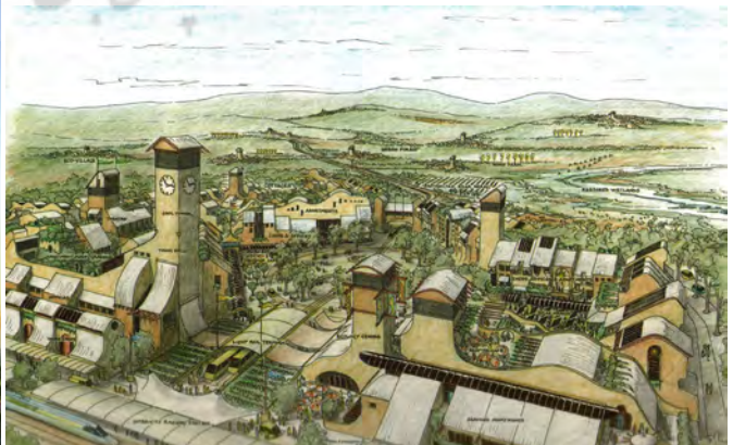
تصویر ۳. طرح از بوم‌شهر ترسیم شده توسط دانتون مأخذ: Downton, 2009: 316. Fig. 3. Conceptual drawing of Ecocity by Downton, Source: Downton, 2009: 316.