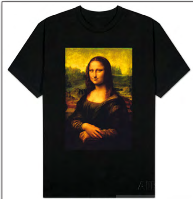
تصویر ۱. استفاده از تصویر هنری (مونالیزا) جهت فروش کالا.