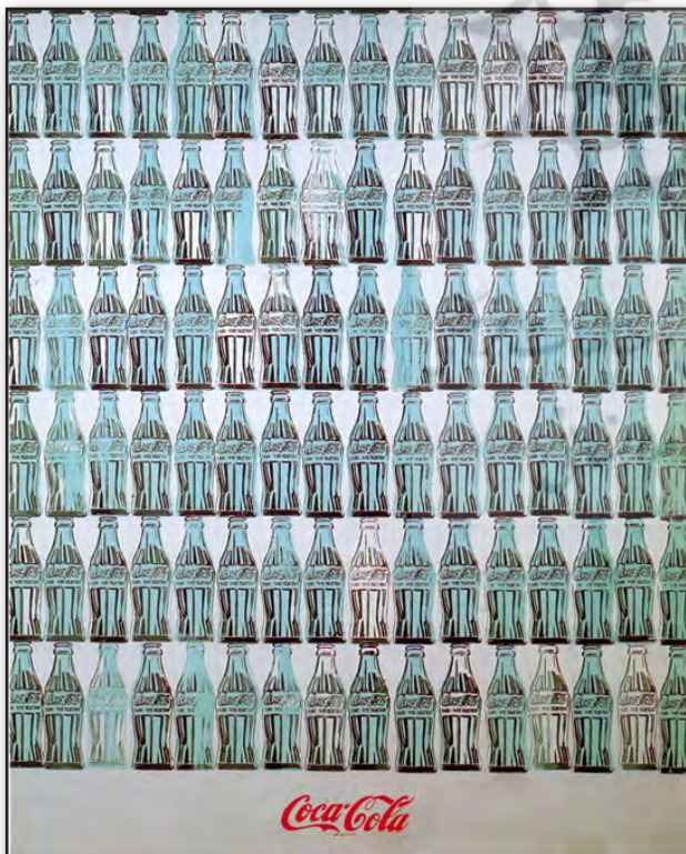
تصویر ۲. اندی وارهل، بطری‌های سبزرنگ کوکاکولا، ۱۹۶۱، رنگ روغن روی بوم.