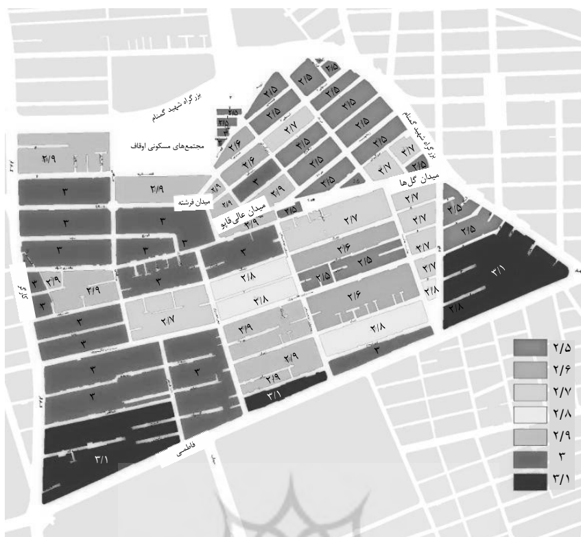
نقشه ۲- قیمت مسکن (میلیون تومان) در محله فاطمی