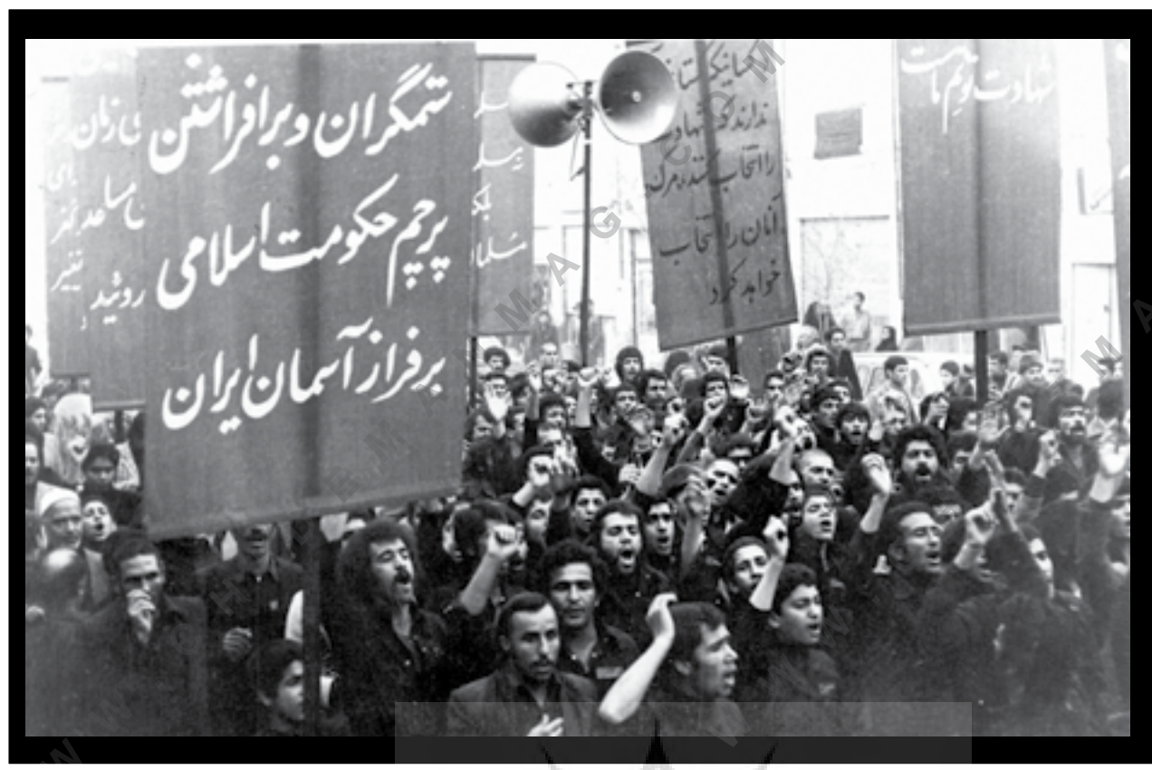
یزد، محرم ۱۳۵۷