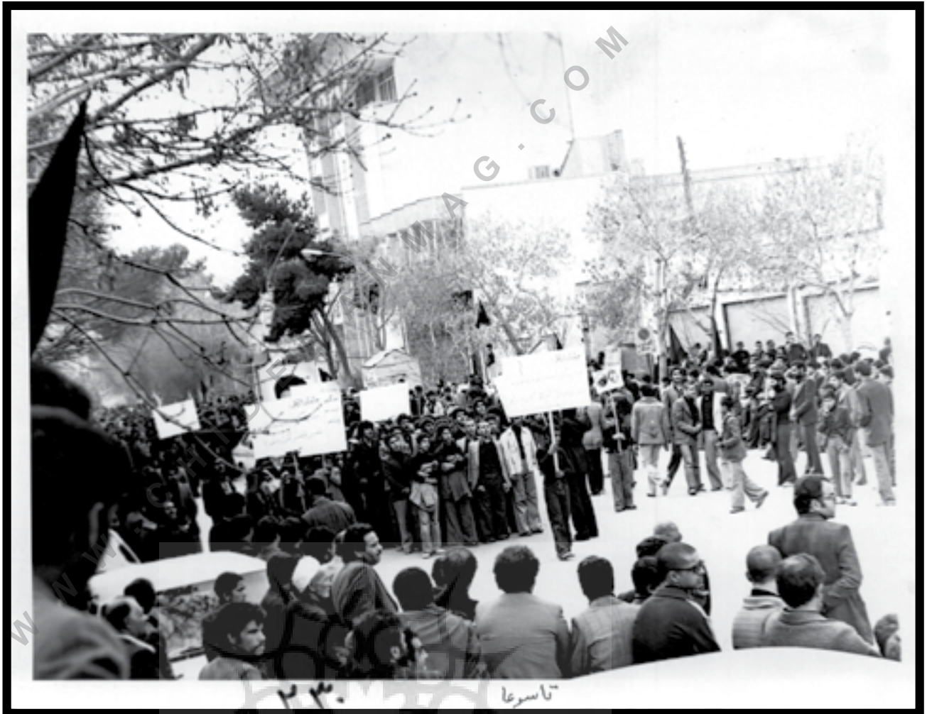
عکاس: مرحوم عبدالجبار قرايیسی، یزد، تاسوعای ۱۳۵۷