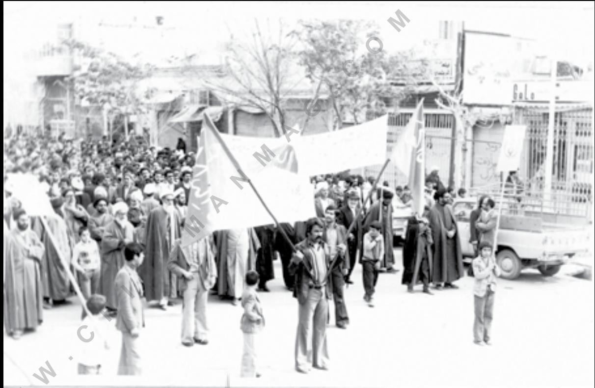
یزد، ۱۳۵۷، تظاهرات مردمی