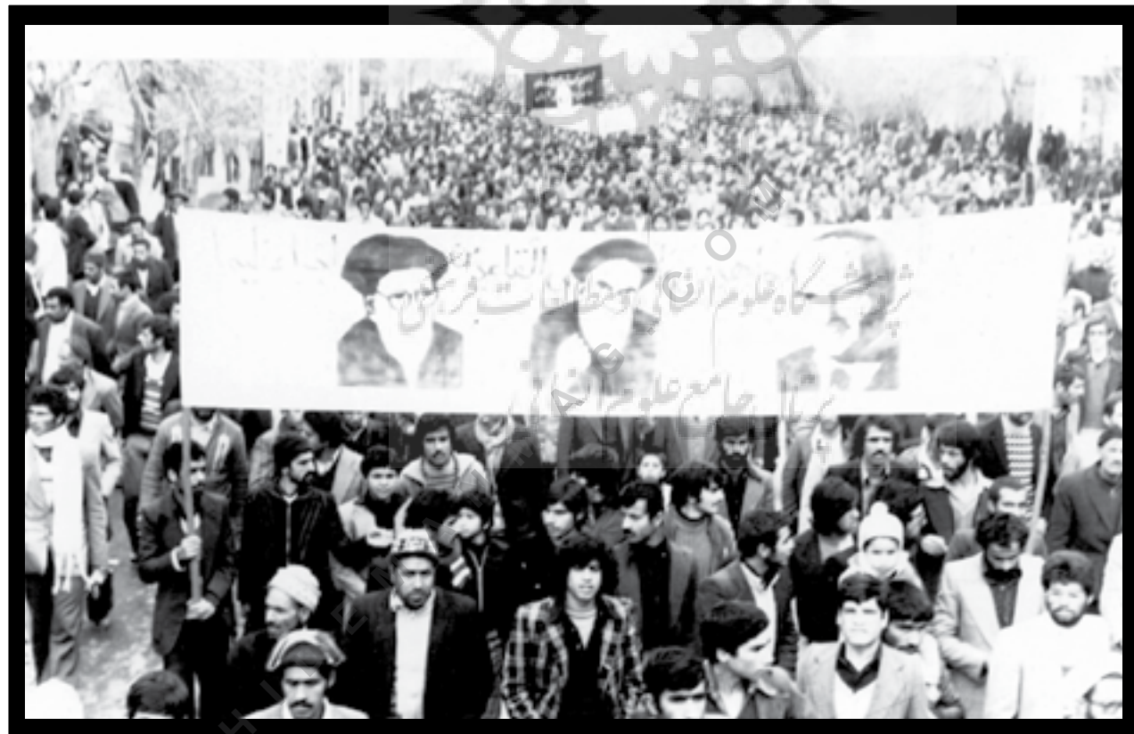
یزد، ۱۳۵۷، تظاهرات مردمی