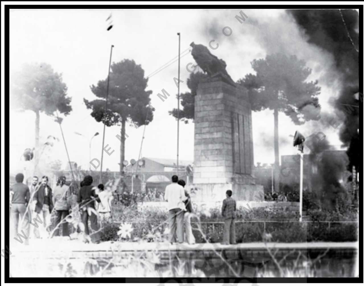
یزد، ۱۳۵۷، میدان مجاهدین (شهید بشهتی فعلی)