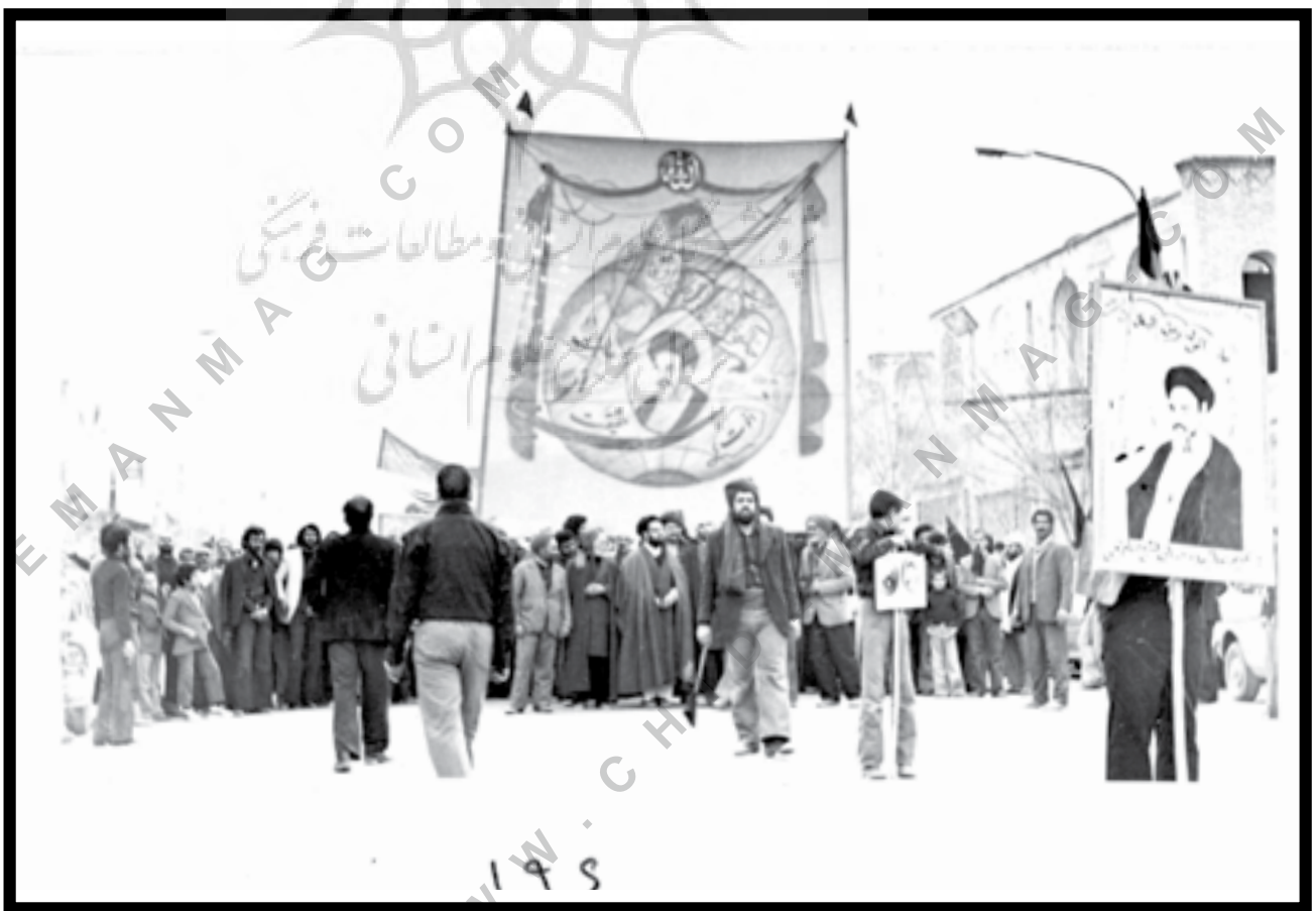
یزد، ۱۳۵۷، میدان بعثت