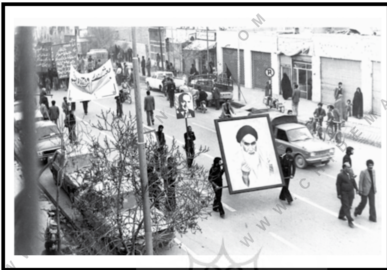
یزد، ۱۳۵۷، هیأت بعثت یزد