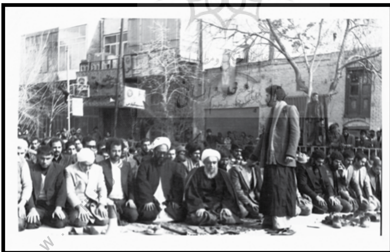
، یزد، ۱۳۵۷، نماز جماعت به امامت شهید محمد صدوقی (ره) در میدان امیرچخماق یزد