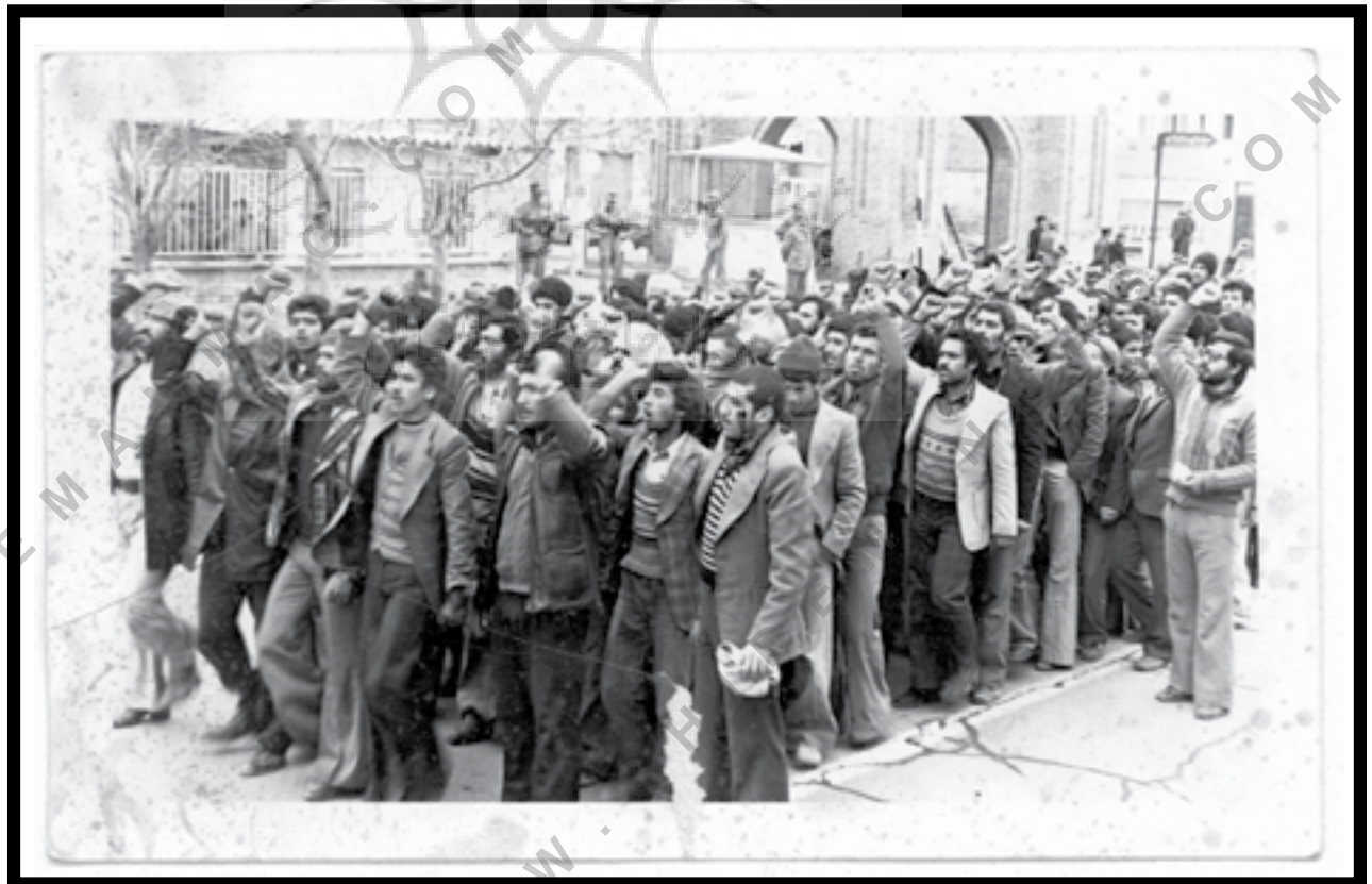
یزد، ۱۳۵۷، تظاهرات مردمی، چهارراه فرهنگیان