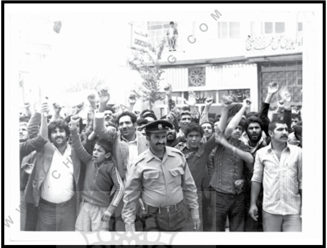
یزد، ۱۳۵۷، روبروی ژاندارمری یزد