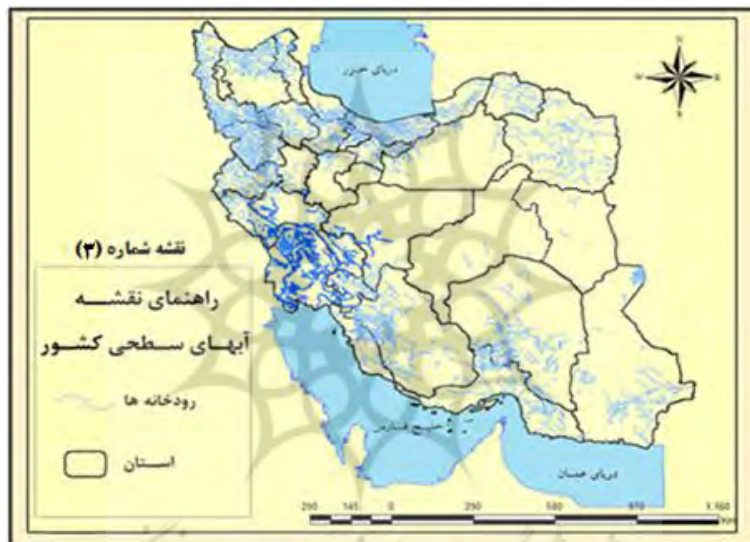
شکل ۳. نقشه وضعیت آب‌های سطحی کشور

مقدار ویژه این عامل ۷/۱۲ است که ۱۸/۲۸ درصد واریانس را تبیین می‌کند. در این عامل، ۶ متغیر بارگذاری شده است. از میان ۶ متغیر مورد بررسی در این عامل، متغیر وسعت جغرافیایی استان با بار عاملی ۰/۸۲۵ و متغیر وسعت کل اراضی قابل کشت به کل کشور با بار عاملی ۰/۸۰۵ بیشترین تأثیر را در سطح توسعه انرژی و آب استان‌ها داشته است (جدول ۸). شکل ۳ وضعیت آب‌های سطحی کشور را نشان می‌دهد که در این نقشه مناطق شمالی و غربی و به‌ویژه منطقه جنوب غربی کشور با تأکید بر استان خوزستان، جایگاه ویژه‌ای دارد.