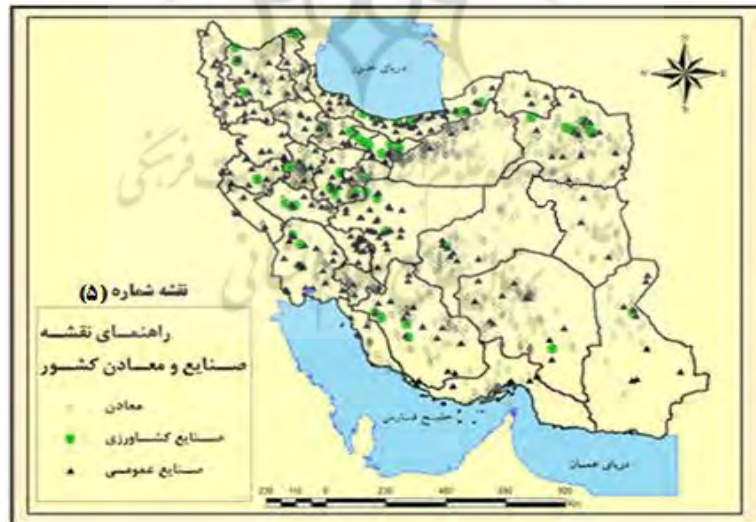
شکل ۵. نقشه صنایع و معادن کشور

نقشه ۵ صنایع کشاورزی و صنایع عمومی در کشور را نشان می‌دهد که صنایع کشاورزی بیشتر منطبق بر مناطقی است که آب و خاک مناسب دارند که برای مثال، استان‌های خوزستان، گلستان، مرکزی و دشت مغان در استان اردبیل از این جمله‌اند. صنایع دیگر نیز مناطق با منابع آب یا مناطق معدنی و یا انرژی‌های احداث شده‌اند. البته استقرار برخی از این صنایع ناشی از عدم مطالعه علمی و ناشی از تصمیم‌گیری‌های غیرکارشناسی بوده است.