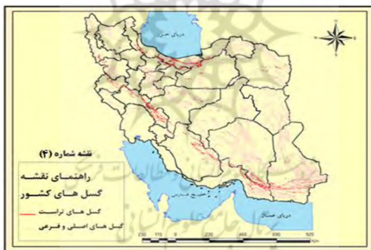
شکل ۴. نقشه گسل‌های کشور

در شکل ۴، نقشه گسل‌های کشور نشان داده شده است که منطقه البرز میانی و رشته‌کوه زاگرس از شمال غرب تا انتهای زاگرس جنوب شرقی و نیز در ادامه، رشته‌کوه‌های جنوب کرمان و سیستان و بلوچستان پتانسیل بالای زلزله‌خیزی دارند.