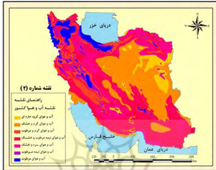
شکل ۲. نقشه آب و هوای مناطق کشور