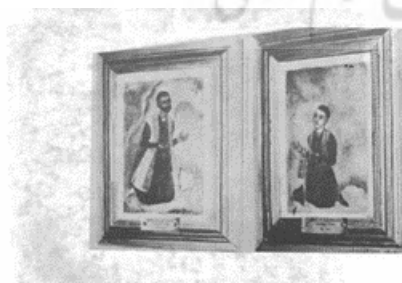
تصویر ۱- چهره‌نگاری وسکان ولیجانیان و هاکوپجان ولیجانیان، میناس، موزه وانک جلفای نو اصفهان.

یکی از تحولات مهم در تاریخ نقاشی ایران را می‌توان در قرن هفدهم در جلفای اصفهان، جستجو کرد. دوره‌ای که به جهت ایجاد ارتباطات وسیع تجاری و فرهنگی بین ایران و اروپا از طریق تجار ارمنی، فضای جدیدی در نقاشی ایران به وجود آمد و تلفیقی از نقاشی سنتی، ارمنی و اروپایی شکل گرفت. اصفهان در عهد صفوی، شاهد چنین تحولی در نقاشی ایران بود. طبق اسناد موجود، میناس زهراییان، اولین نقاش توانمند ارمنی است که نقاشی اروپایی را وارد نقاشی ایران کرد. توانمندی او در کار با رنگ‌روغن در بوم‌های بزرگ اندازه، چهره‌نگاری‌های متفاوت با ارائه شخصیت‌پردازی‌های روان‌سازانه، تاکید بر سایه روشن و پرسپکتیو و سه‌بعدی بخشیدن به تصویر و نهایتاً جنبه عینی و زمینی بخشیدن به تصویر، آثار او را با نقاشان دوره‌های قبل و نقاشان هم‌زمان خود، متفاوت می‌کرد. چنین به نظر می‌رسد که شاید یکی از مهمترین تأثیرات میناس در تاریخ نقاشی ایران، تعلیم استاد رضا عباسی، نقاش نامی ایران باشد، بطوری‌که اسلوب نقاشی رنگ‌روغن را رضا عباسی از برخی نقاشان خارجی و هنگام کار با میناس فراگرفته بود. میناس در قرن هفدهم، نقاشی منحصر به فرد بود که هنر خود را به صورت حرفه‌ای و متناسب با نیاز جامعه و مفهوم زمان اجرا می‌کرد. به همین جهت، در دوره مورد اشاره با تلاش او نقاشی وارد زندگی خصوصی مردم شد و جایگاه ویژه‌ای در زندگی فردی و اجتماعی پیدا کرد. حضور نقاشی در خانه‌ها، به عنوان عنصری لاینفک در زندگی انسان، یکی از برجسته‌ترین تأثیرات نقاش در جامعه ایرانی محسوب می‌شود.