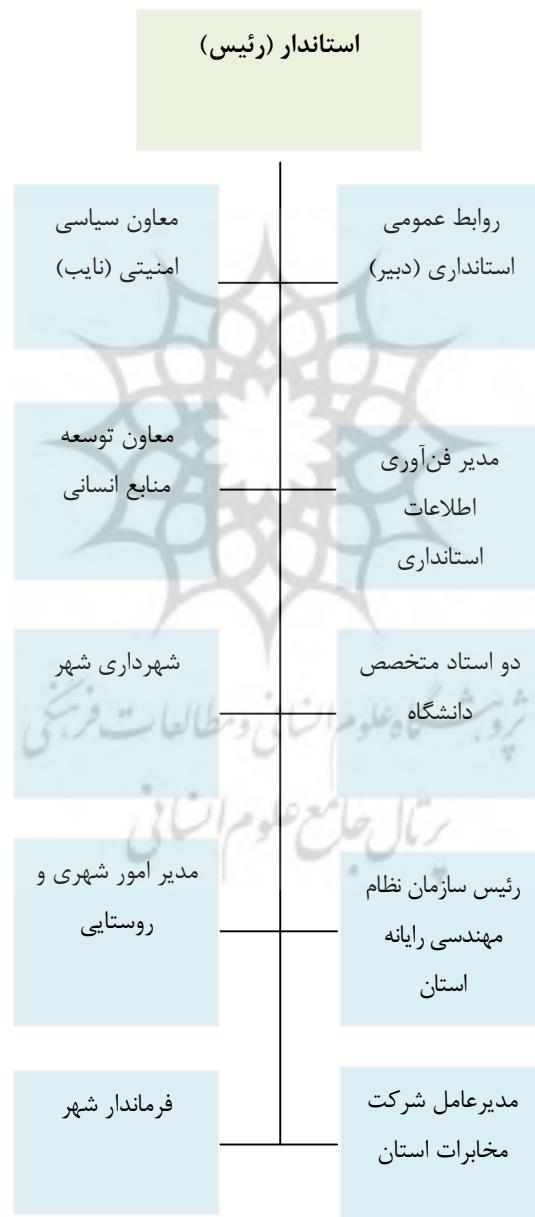
نمودار ۱- ساختار پیشنهادی شورای شهر الکترونیکی برای استان قم