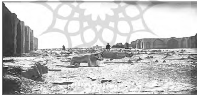
تصویر (۱): تخت فولاد در دوره قاجار - ارنست هولستر، کتاب هزار جلوه زندگی

در عهد سلطان سلیمان و با وفات میرزا رفیعا نائینی (۱۰۸۲ ق) و آقا حسین خوانساری (۱۰۹۸ ق) و احداث بقاع زیبا که از لحاظ معماری و تزئینات از بهترین نمونه‌های فاخر می‌باشد، تخت فولاد باز هم گسترش یافت. تضعیف دولت صفوی از لحاظ سیاسی و اقتصادی در عهد شاه سلطان حسین مانع از گسترش تخت فولاد و احداث بقاع بر مزار علمای دینی نشد، چنان که در این ایام نیز تکایایی همچون «فاضل سراب»، «خاتون آبادی»، «ملا اسماعیل خواجویی» و «آقارزی» شکل گرفتند و به تخت فولاد وسعت بیشتری بخشیدند. با همه این ساخت و سازها، هنوز زمان زیادی تا اتصال نهایی تخت فولاد به کالبد شهری اصفهان باقی مانده بود. حمله افغانه به سال ۱۱۳۵ ق باعث تخریب و ویرانی تکایای متعدد این آرامگاه شد و بسیاری از مصالح و سنگ مزارات آن برای حصاری که اشرف افغان ساخته بود به کار رفت. در دوره افشاریه و زندیه توجه زیادی به تخت فولاد نشد و به جز چند بقعه و چهارتاقی از جمله «بقعه فیض علیشاه» بنای چندان مهمی در آن تأسیس نگردید. آن گونه که از متون تاریخی برمی‌آید، تخت فولاد در اوایل حکومت فتحعلیشاه قاجار، روستایی کوچک با جمعیتی اندک بود و گورستان آن همچنان در خارج از برج و باروی اصفهان قرار داشت. (تصویر ۱)