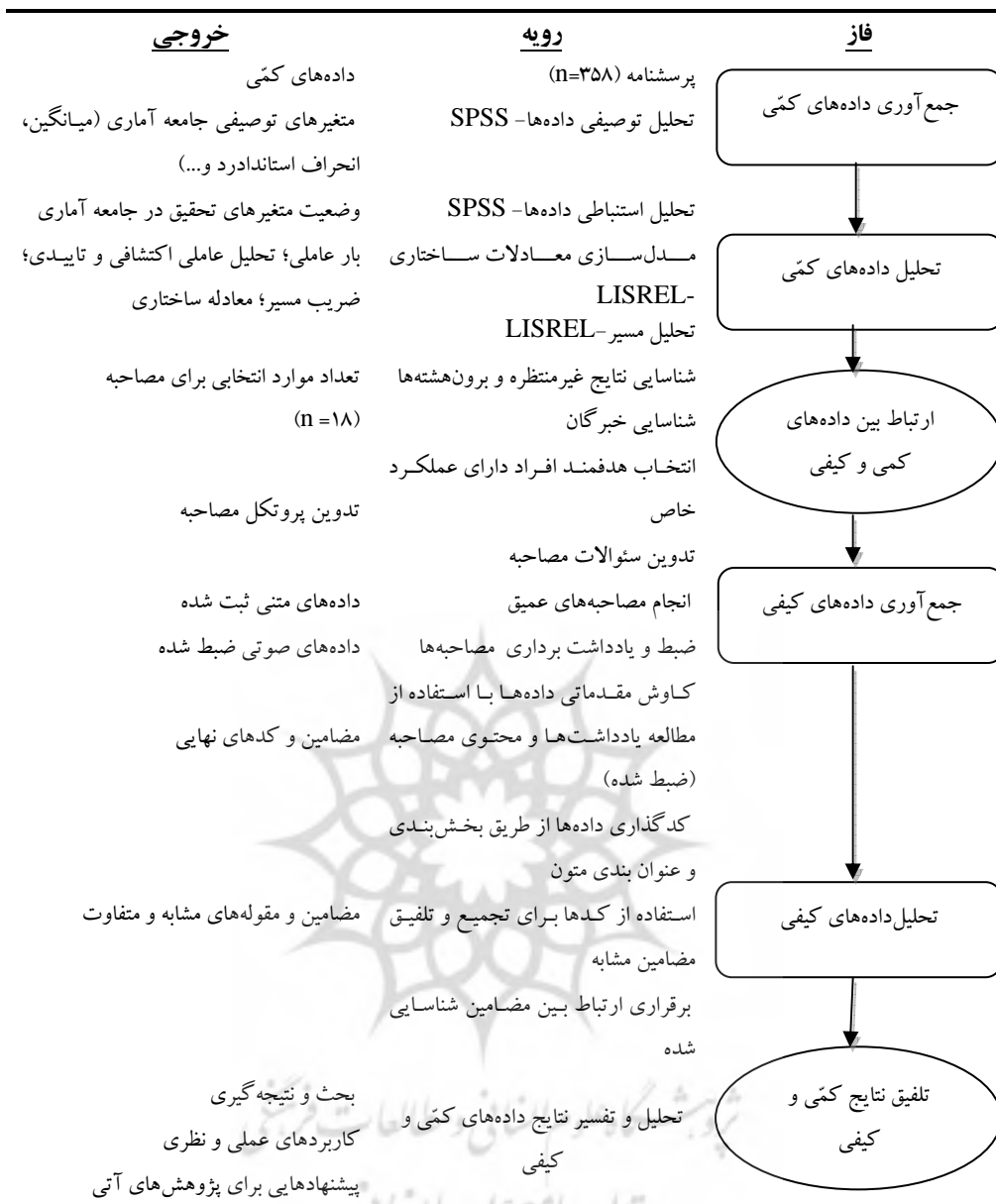
شکل ۳: الگوی تصویری روش‌شناسی پژوهش ترکیبی ترتیبی - تبیینی