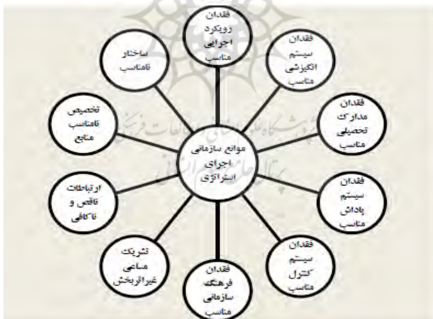
شکل ۱- موانع اجرای راهبرد (رحیمی‌نیا و همکاران ۱۳۹۱)

رحیمی‌نیا و همکارانش در تلاش برای دسته‌بندی دلایل شکست راهبردها به چهار دسته عوامل دست یافتند که شامل پیامدهای برنامه‌ریزی، مسائل سازمانی، مدیریتی و فردی می‌باشند. علاوه بر این در مطالعه‌ای که رحیمی‌نیا و همکارانش انجام دادند، عوامل محیطی به دسته‌بندی آن‌ها از دلایل شکست راهبردها، اضافه گردید. مطالعه یاد شده، موانع سازمانی اجرای راهبرد را یکی از عوامل مهم در عدم موفقیت اجرای راهبردها دانسته و آن را شامل ساختار نامناسب، تخصیص نامناسب منابع، ارتباطات ناقص و ناکافی، تشریک‌مسابی غیراثربخش، نبود فرهنگ سازمانی مناسب، نبود نظام کنترل مناسب، نبود نظام پاداش مناسب، مدارک تحصیلی نامناسب، نبود نظام انگیزشی مناسب و نبود رویکرد اجرایی مناسب می‌داند.