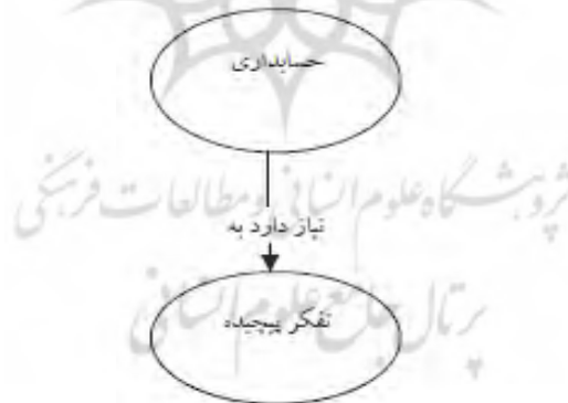
نمودار (۱): یک نگاره مفهومی ساده

مفهوم نگاری، یک تکنیک و ابزار کلاسی خلاقانه است که می‌تواند آموزشهای ما را عمیق‌تر کند. و اقدامی موثر در جهت تقویت مهارت‌های تفکر دانشجویان از طریق فعالیت‌های یادگیری معنی‌وار به شمار می‌رود. مفهوم نگاری می‌تواند به دانشجویان کمک کند تا آنچه را که می‌دانند سازماندهی کرده و به روشهای پیچیده تری فکر کنند. نگاره‌های مفهومی، ترسیم‌ها یا نمودارهایی هستند که روابط مهمی را نشان می‌دهند که یک دانشجو برای یادگیری دانش ایجاد می‌کند. در ساده‌ترین شکل آن، یک نگاره مفهومی فقط دو مفهوم مرتبط به هم از طریق یک یا چند کلمه ارتباط دهنده است. مثلاً "حسابداری به تفکر پیچیده نیاز دارد" یک نگاره ساده تشکیل شده از یک بیانیه معتبر درباره مفاهیم "حسابداری" و "تفکر پیچیده" را ارائه می‌کند (مس و لیویی، ۲۰۰۵).