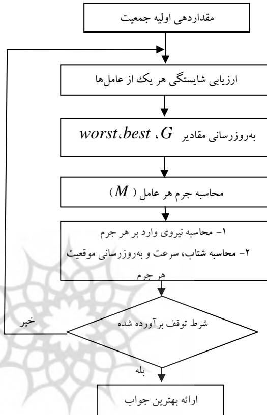
شکل ۱. نمودار مراحل اجرای الگوریتم جستجوی گرانشی

احتمال حرکت جرم در آن بعد بیشتر می‌شود. تغییر موقعیت جرم در یک بعد از فضای باینری، به معنای تغییر مقدار آن از صفر به یک یا برعکس است.